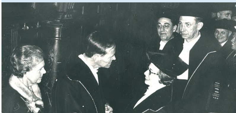
In 1958 werd zij de eerste vrouwelijke hoogleraar in het vak.