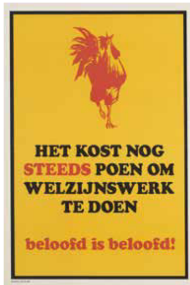
Affiche van toen, nog steeds actueel.

Een Historisch Centrum Sociaal Werk | Zorg & Welzijn wil daar structureel verandering in aanbrengen. Niet als een nieuw instituut of een soort museum, maar als een kernachtige netwerkorganisatie met een beperkte, maar actieve personeelsformatie (1,5 fte) die gedragen wordt door een groot aantal relevante organisaties die opereren in het brede sociaal domein, zoals kennisinstituten, overheden, bracheorganisaties, beroepsverenigingen, onderwijs- en onderzoeksinstituten. Het is de bedoeling dat