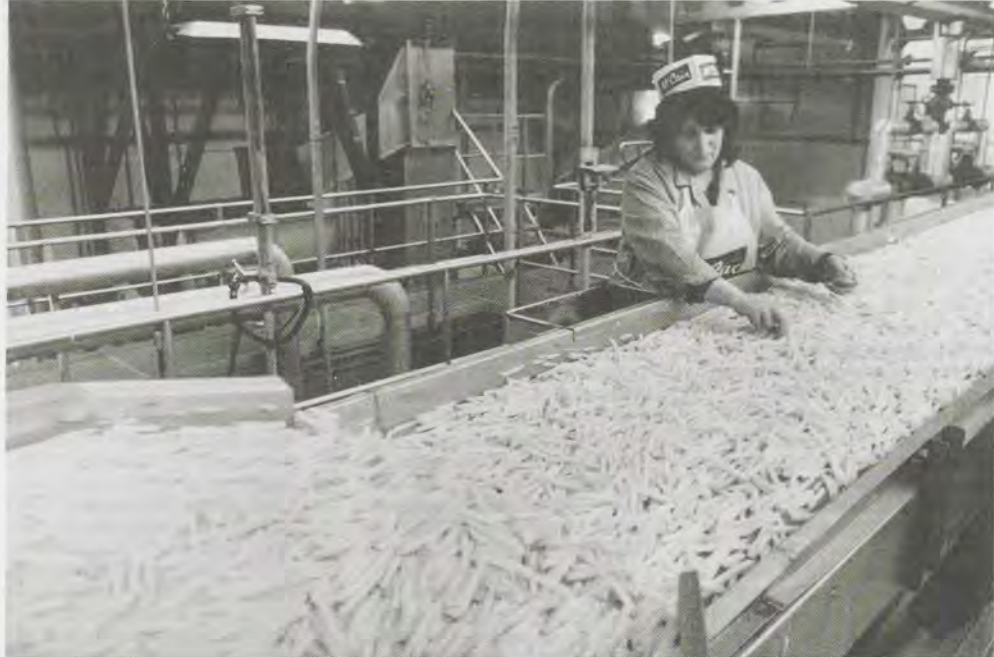
→ Toename van het aantal arbeidsongeschikten ging hand in hand met een sterke stijging van de produktiviteit...

kosten per eenheid produkt van de EG. Bovendien kan de kwaliteit van het sociale zekerheidssysteem niet los worden gezien van zaken als arbeidsrust en het gebruik van de gezondheidszorg, die in Nederland juist een opvallend gunstig beeld te zien geven. Volgens de organisaties is het zeer wel denkbaar dat de kosten en baten van de huidige arbeidsongeschiktheidswetgeving macro-economisch gezien tegen elkaar opwegen.