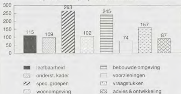
Opbouwwerkprojecten anno 1990

open opgave van projecten is door middel van inhoudsanalyse teruggebracht tot een achttal hoofdrubrieken. Het werk ten behoeve van specifieke groepen, met name minderheden, komt het meest voor, gevolgd door projecten in de bebouwde omgeving. Opvallend is het gegeven van de 'maatschappelijke vraagstukken'. Daaronder hebben we projecten rond werkgelegenheid, sociale zekerheid, onderwijs, gezondheid en racisme laten vallen. Dit soort projecten komt beduidend meer voor dan projecten rond leefbaarheid, ondersteuning van kaders en woon- en leefomgeving.