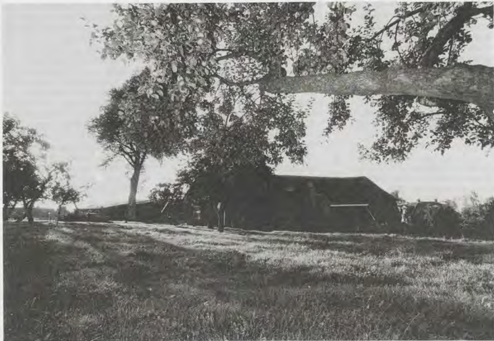
Baloo – Dorpje in het groen