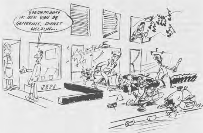
"De systeemspecialisten trekken de schaarse middelen naar zich toe".