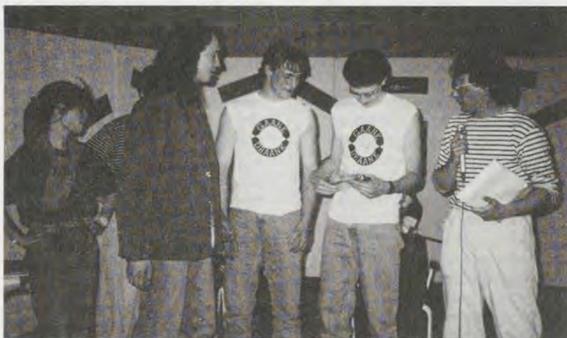
Jongeren uit Wijster

Het WEB heeft alleen een kantoor en vergaderingen worden in het dorpshuis of het café gehouden. De plaatselijke werkplannen weerspiegelen wat werken vanuit de basis betekent en hoe het WEB verweven is met een veelvoud van activiteiten: ondersteuning verenigingsleven, kadertraining vrijwilligers, voortgangsbewaking van het werk voor kwetsbare groepen (tieners-meiden) en het stimuleren van nieuwe maatschappelijke ontwikkelingen zoals basiseducatie en het Vrouwen