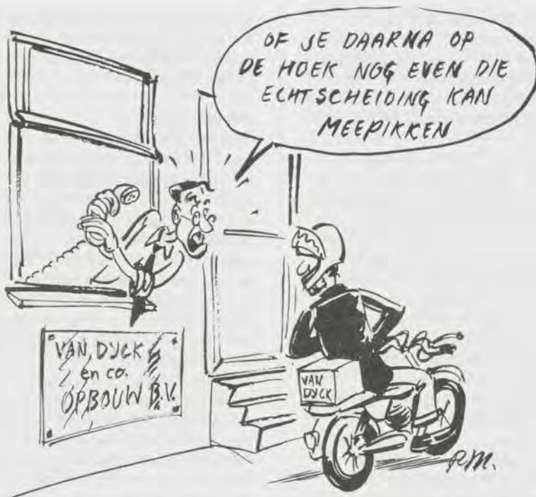
Wijkteams: conflictbemiddeling is één van de belangrijkste taken binnen de wijkteams (ill. Ruurd Kok)

veronderstelling dat de overheid niet alle problemen kan oplossen. De bewoners moeten er zelf de hand in hebben om oplossingen te zoeken voor hun problemen. Het is echter wel een goede zaak dat er vanuit de overheid bereidheid wordt getoond daarvoor extra aandacht en ruimte te geven. We hebben wel iets op te merken bij de wijze van presentatie. Als het gaat om veranderingen in werkwijze kun je dat beter niet van bovenaf droppen. De idee achter de sociale vernieuwing is goed maar de invulling door bewoners moet uitgangspunt zijn. De afstand tussen het uitvoeringssysteem van de sociale vernieuwing en de leefwereld van de bewoners moet kleiner worden. De tendens zoals die nu waargenomen kan worden - werken in de wijk via één loket, waarbij bewoners alle instanties kunnen bereiken waarmee ze te maken krijgen - moet verder ontwikkeld worden. Het systeem kan onder invloed van de so-