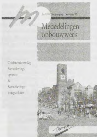
Conferentieverlag Samenlevingsopbouw & Samenlevingsvraagstukken f 10,-- Nr. 95, juni 1991