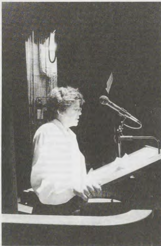
Hil Post: "...de politiek laat ons in de kou staan"

Tijdens de manifestatie werd het onderzoeksrapport "Afgekeurd is niet afgedankt" gepresenteerd door Ca-