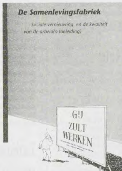
De samenlevingsfabriek, Sociale vernieuwing en de kwaliteit van de arbeid(s-toeleiding), f 14,50 Nr. 96, juli/augustus 1991

Redactie en administratie Prinsegracht 51, 2512 EX Den Haag, tel. 070-3804431, fax 070-3809973.