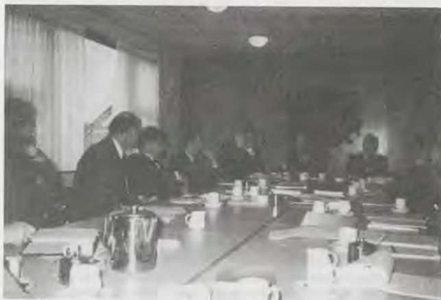
Men luistert geboeid naar elkaars bijdragen.

welzijnsbeleid. Dat was ook niet de oorspronkelijke opzet van de (toenmalige) EEG (Europese Economische Gemeenschap), die tegenwoordig EG heet. De EEG is ooit opgericht met als belangrijkste doel het voorkomen van crisissituaties, zoals die zich in de jaren '30 voordeden, naar aanleiding van de Wallstreet-crash van 1929. Teneinde een dergelijke totale economische ineenstorting voor de toekomst te kunnen voorkomen werd besloten lering te trekken uit deze economische crisis met de bekende politieke 'nasleep'. Allereerst werd de zware industrie gesaneerd en herverkaveld (in de Europese Gemeenschap voor Kolen en Staal in 1952; dit was trouwens de eerste keer dat Nederland staatsbevoegdheden overdroeg aan een supra-nationaal orgaan. In 1957 kwam het Verdrag van Rome tot stand en hiermee werd de basis gelegd voor economische eenheid in Europa. Sindsdien zijn er steeds meer landen toegevoegd aan die (gebrekige, immers niet volgroeide) economische eenheid. De samenwerking richtte zich vooral op industrie, landbouw, handel, de energievoorziening, veiligheid en het monetaire verkeer. Welzijn is een 'nieuw'