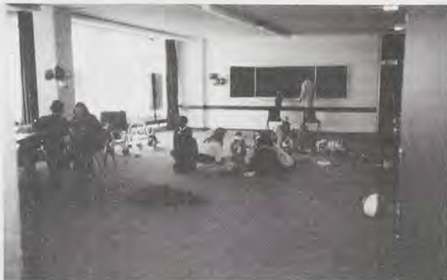
Er was ook kinderopvang geregeld door de organisatoren van de bewonersdag.

In kritieken wordt wel eens gezegd dat dergelijke projecten niet nieuw zijn. Die discussie werkt alleen maar verlamdend. Alsof het slecht is om aan te sluiten bij bestaande activiteiten. Vernieuwend hoeft niet betekenen dat alles wat tot nog toe gebeurd niet of minder goed was. Maar het gaat wel om een vernieuwing, een versterking en een verbreding van het proces, waarbij relaties worden gelegd tussen verschillende activiteiten. Kenmerkend voor sociale vernieuwing is een oplossingsgerichte aanpak. Diensten en instellingen proberen niet uit te gaan van hun bevoegdheden, van geijkte patronen, van regeltjes die bepalen wat wel en niet mag. Eerst moeten oplossingen bedacht worden voor de problemen die we willen aanpakken, los van regels en beperkingen. En dan blijkt er vaak meer te kunnen dan we dachten. Organisaties