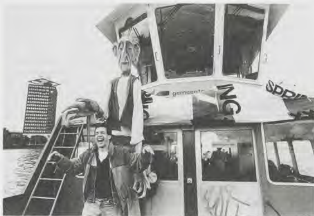
Bewoner, de lachende derde tussen private en publieke partijen?

Welzijnswerkers kunnen een belangrijke rol spelen in het organiseren van oplossingen voor bestaande problemen aan de zwakke kant van de samenleving. Veldhuysen houdt dan ook een pleidooi voor een versterking van deze rol, die echter wel nieuwe strategieën vergt. Bij het lezen valt op hoe belangrijk het informele is. Een dilemma waar het boek zich overigens niet aan kan onttrekken ligt in het trachten vast te leggen van de succesfactoren waardoor het flexibele en informele gereguleerd wordt (10 stappen tot succes). Gewaakt moet echter worden voor het institutionaliseren van processen, met het gevaar voor nieuwe machtsposities en strakke bevoegdheden. Een goed middel daartegen is het steeds maar weer de vraag stellen of de doelstellingen gehaald worden. Iets wat bij de 'social return'-aanpak van Rotterdam gedaan wordt en waaraan bijvoorbeeld arbeidsburo's een puntje kunnen zuigen (met hun groot apparaat bemiddelen ze maar een fractie van de arbeidsmarkt). Een nieuwe strategie voor de welzijnswerker is die van de makelaar. Hij/zij bouwt netwerken op, zorgt dat er initiatiefnemers van verschil-