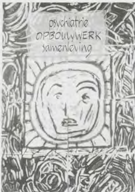
Omslag van het verslag van de werkconferentie 'Categorieel opbouwwerk in vier stadsdelen', 13 juni 1991, Amsterdam.