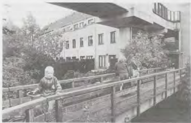
Niet alleen de woningcorporaties hopen dat Antilopespoor weer een aantrekkelijke wijk wordt.

aangewezen op fietstunnels - donkere wegen waar men zich over het algemeen onveilig voelt.