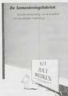
De samenlevingsfabriek, Sociale vernieuwing en de kwaliteit van de arbeid(s-toeleiding), f 14,50 Nr. 96, juli/augustus 1991

Met ingang van 1992 kost een abonnement f 62,50 een tweede abonnement e.v. f 57,50. Losse nummers zullen f 8,50, themanummers f 12,50 en specials f 14,50 (excl. porto) gaan kosten.