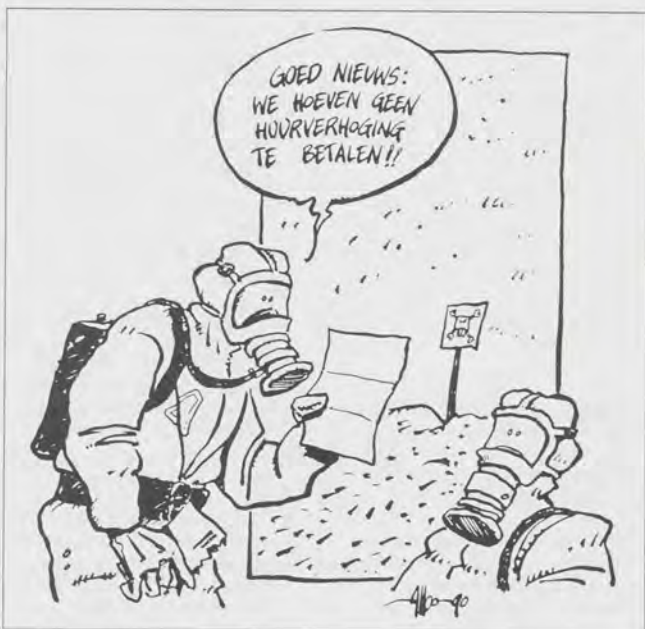
Albo Helm, uit Woonpeil

Stichting Nederland Gifvrij, juni 1992, 4p f 3,50. Te bestellen door het bedrag over te maken op giro 2203839 tnv. Stichting Nederland Gifvrij te Utrecht o.v.v.: Bestelling Informatiekatern Huur- en onroerend goedbelasting-acties. ■