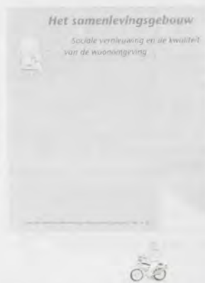
Het samenlevingsgebouw, Sociale vernieuwing en de kwaliteit van de woonomgeving, f 14,50 Nr. 91, februari 1991