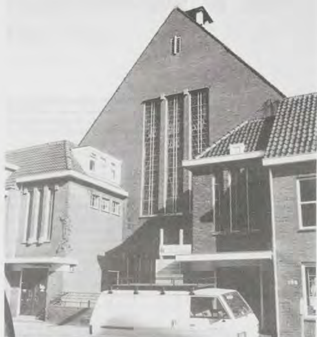
De Gereformeerde Kerk, vóór de verbouwing tot Oosterse Bazar.

laatsten bij de Ommense gemeentelijke beslommeringen worden betrokken, drong de gemeente niet door tot de eindselectie. De jury is van mening is dat de gemeente Ommen wellicht een prijs voor het "woonwagenebeleid" verdient, een oordeel over het "minderhedenbeleid" kan zij vooralsnog niet geven. Voor Zevenaar geldt in principe hetzelfde. Genomineerd door de st. Dewan Maluku Zevenaar huisvest deze gemeente een minderheden-groep die voor zestig procent uit Molukkers bestaat. Ofschoon er ook nog Turken, Spanjaarden, asielzoekers en vluchtelingen wonen, is de problematiek te kleinschalig om een groot aantal specifieke voorzieningen te rechtvaardigen. Het speciale drugsofvangproject voor Molukkers wordt in positieve zin vermeld. Toch is hier volgens de jury sprake van een om praktische en organisatorische redenen vooral op Molukkers gericht beleid. De andere groepen zijn domweg te klein. Misschien kan dit criterium expliciet worden opgenomen in de door de jury gehanteerde criteria.