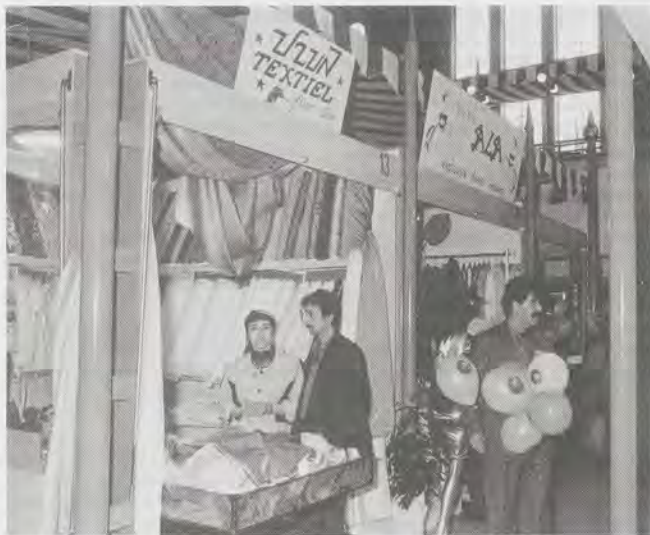
Interieur van de Oosterse Bazar (foto: Auke Pluim).

een onderscheiding. Als er in een gegeven gemeente een goed minderheidsbeleid wordt gevoerd, als in die gemeente de zelforganisaties van minderheden tevreden zijn, kunnen zij die gemeente nomineren. Dit is op zich al een belangrijke stap voorwaarts in de strijd om een waarschijnlijk democratisch en tolerant gemeentebestuur. Het opbouwwerk in de Nederlandse gemeenten mag zich uitgedaagd voelen om op dit gebied vorderingen te maken. Wat Deventer kan, moet in andere gemeenten ook mogelijk zijn. Want het Deventer opbouwwerk heeft een niet onaanzienlijke bijdrage geleverd aan het winnen van deze LAO-prijs. ■