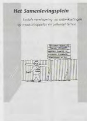
Het samenlevingsplein, Sociale vernieuwing en de ontwikkelingen op maatschappelijk en cultureel terrein, f 14,50 Nr. 99, december 1991