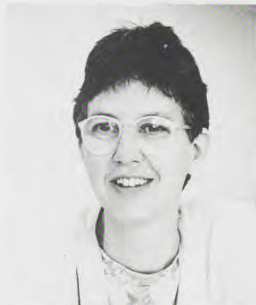
De wethouder