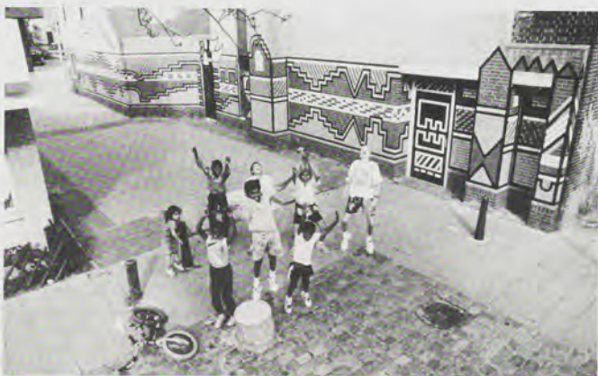
Boskant 'na behandeling'.

gaande. Een discussie die gaat over de invloed van stedenbouwkundige kenmerken op veelvoorkomende criminaliteit.