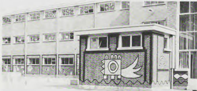
De Roosenboom 'na behandeling'.

mooi vinden en er zich bij betrokken voelen? Het antwoord ligt, denk ik voor de hand: door mensen een stem te geven in de inrichting van hun omgeving. Want als u een auto gaat kopen beslist u toch zeker zelf over het merk en het type?