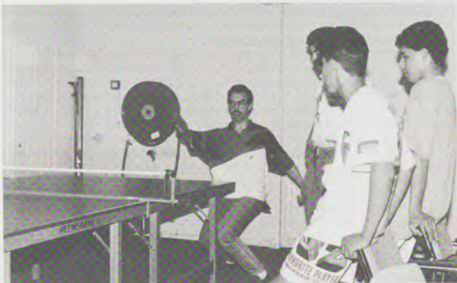
Marokkaanse jongeren recreëren tijdens een kaderweekend te Driebergen.

Hassani stimuleert de Marokkanen van El Ouahda en De Vuist om kadercursussen te volgen. 15 Mensen van El Ouahda hebben een training gehad voor het houden van een spreekuur. Via een werkervaringsplaats zijn drie mensen spreekuur gaan houden bij bewonersorganisaties. Mensen van De Vuist hebben een training voor bestuursleden gedaan. Hassani heeft nog twee kadercursussen in petto: over het geven en ontwikkelen van voorlichting en over projectmatig werken. Jongeren van De Vuist hebben ook deelgenomen aan de studiedagen over buurtbeheer en over de samenwerking van bewonersgroepen in bewonersplatforms, die de S.G.S. (Samenwerkende Groepen