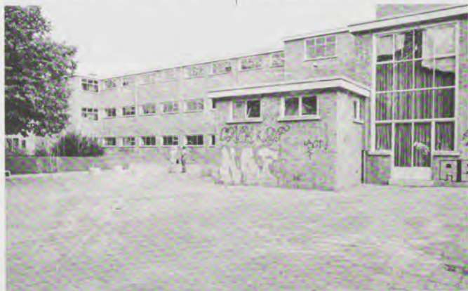
Basisschool De Roosenboom, Den Haag.

men en fortificaties. Er ontstaan vestingen die de omgeving alleen een a-socialere aanblik geven, met als