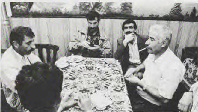
Waar ben je bang voor? Buitenlanders zijn ook leuk! (SBO)

"Het heeft geen zin als Nederlandse organisaties dingen voor de migranten organiseren, zonder de migranten er daadwerkelijk bij te betrekken. Want dan organiseren ze misschien dingen waar migranten helemaal geen behoefte aan hebben. En ook de onderwerpen, waarover in autochtone organisaties vergaderd wordt, spreken Marokkanen vaak niet aan. Ik heb geen behoefte aan vergaderen over te weinig licht op straat. Op het platteland, waar de meeste Marokkanen vandaan komen, is er veel minder straatverlichting, dus dat er hier te weinig licht op straat zou zijn, dat is voor mij onbegrijpelijk. Ik wil ook niet vergaderen over hondepoep, maar over onderwerpen die meer leven bij de Marokkaanse gemeenschap zoals vandalisme of graffiti. En als Marokkaanse jongeren van