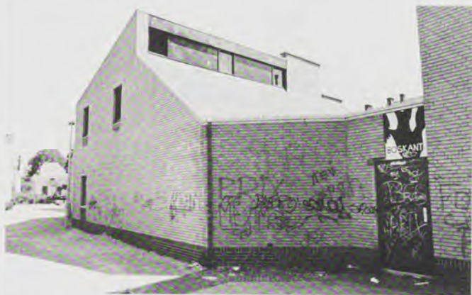
Clubhuis Boskant, Den Haag.