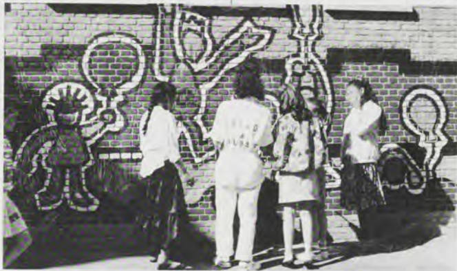
Leerlingen van de Roosenboom worden ingeschakeld.