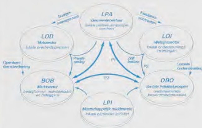
Figuur 1. - Basismodel voor strategische samenwerking De ingrediënten van een partnerschapsdemocratie

ke domein wil verhogen, het beste inspelen op de reeds toetredende burger? Hoe speelt de ondernemende burger het beste in op een terugtrekkende overheid? De uitdaging ligt erin, te bepalen waar en wanneer de overheid moet terugtrekken. Kan de overheid zich zo terugtrekken, dat nieuwe mogelijkheden voor de burger ontstaan?