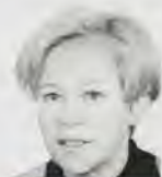
door Tonny Verrijt.