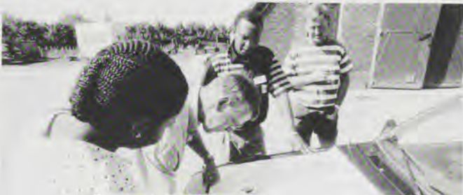
Boeren schetsen de ontwikkeling van hun bedrijf

De voorlichters, aanvankelijk onder de indruk van de kapitaalintensieve agrarische productie en de fijnvertakte organisatievormen in het kleine dorp, ontdekten gaandeweg de beperkingen. Mest- en melkquota, verzuring en schaalvergroting die erfopvolging onmogelijk maakt, gaven eerst aanleiding tot ongeloof en later tot hoofdschudden. Ook de enorme kosten van de verzuring van het basisonderwijs, de vervuiling van het oppervlaktewater, geluidshinder, en het handhaven van een minimale verkeersveiligheid werden reden tot relativering van