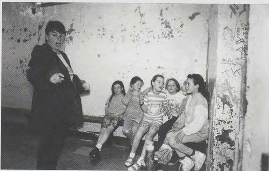
The Balcony Belles Drama group workshops with children in the North Wall Women's Centre

'Access and Participation in the Arts', and an intervention undertaken by CAFE, on behalf of the Department of Arts, Culture and the Gealtacht, to enable people who are long-term unemployed to develop their arts skills through locally-based, high quality arts activity.