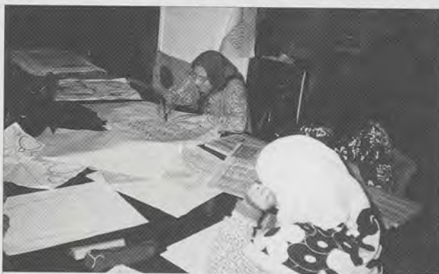
We visited a community enterprise project in Tensa

The estate includes a city farm, adventure playground and a learning centre for disabled people. There is a house representative system for each block of flats. They welcome newcomers, act as a