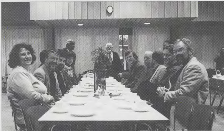
Meet the Combined Bureau

Once approved, the development plan will be used to send to potential new members of the Bureau, European NGOs and other organisations. It will also form the basis of approaches to trusts