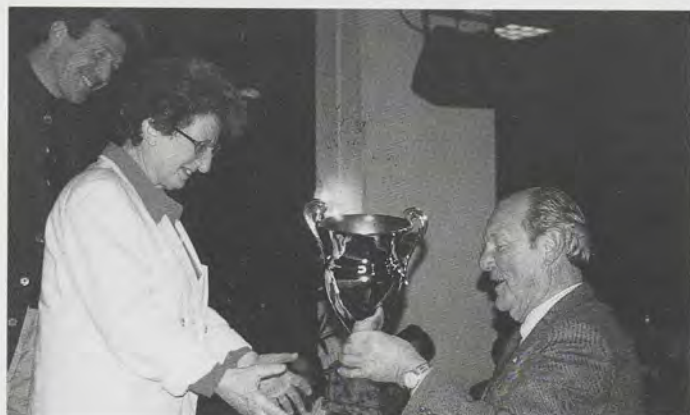
het Zeeuws bureau voor Alcohol & Drugs te Middelburg (prijs beschikbaar gesteld door Grafisch Bedrijf Stimio BV)

uitreken. Deze prijs (die naast de beker ook een geldbedrag van Fl. 2.500,- een oorkonde en een boeket omvat) voor "excellent maat-