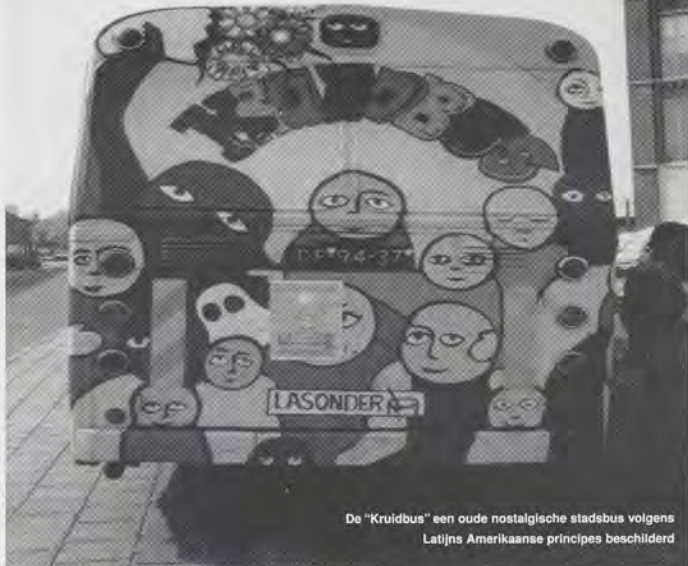
De "Kruidbus" een oude nostalgische stadsbus volgens Latijns Amerikaanse principes geschilderd

De omgebouwde camper "JOP" heeft momenteel een houten nooddeur. Er wordt, in eigen beheer, een grotere ach-