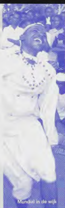
Mundial in de wijk

naar sport, muziek, mode en media uit de Westerse Wereld. Maar wat dan? Fomtugol helpt zoeken naar aansprekende alternatieven in de eigen omgeving. Fomtugol laat zien dat er op eigen kracht veel mogelijkheden liggen in de organisatie van vrijetijdsbesteding voor en door jongeren. Ook al heb je weinig werk en scholing, je kan wel zelf sporten en muziek of radio maken. Je kan er zelfs heel goed in worden. Eenmaal actief zit je lekkerder in je vel en via vrijwilligerswerk doe je ook veel sociale contacten en ervaring op. Al doende leer je, verwerf je een maatschappelijke positie als vrijwilliger en doen zich eventueel ook nieuwe mogelijkheden voor op het gebied van betaald werk. Fomtugol draagt praktisch bij aan de vorming van het noodzakelijke kader en de maatschappelijke structuren voor een dergelijk verenigingsleven. Individuele en maatschappelijke vorming is daarbij op twee manieren belangrijk. Ten eerste als middel in de opbouw van een duurzaam verenigingsleven voor jongeren. Ten tweede als doelmatig neveneffect van actieve betrokkenheid van jongeren bij sport, cultuur en media. Naast technische expertise op het vlak van sport, cultuur en radio is Fomtugol daarom ook geïnteresseerd in ervaringen uit het sociaal-cultureel werk en het opbouwwerk.