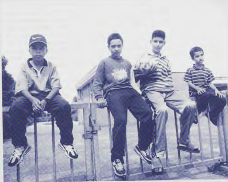
Marokkaanse jongens uit de Utrechtse wijk Kanaleneiland.