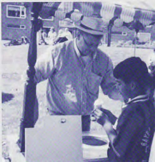
Een ijsje voor de spelende jeugd.

Er zijn in het kader van het deelproject Sporten om de Hoek enkele voetbaltoernooien gehouden in de Hoge Mors. Gelukkig kon een rugbyvereniging een trainer leveren, maar omdat er geen jongerenwerker beschikbaar was om de sportactiviteiten te runnen, is maar een deel van de aspiraties op dit vlak verwe-