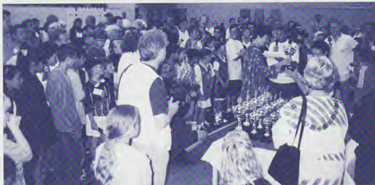
De prijsuitreiking.

De eerste stad in Nederland met een project voor sport, tolerantie en fair play in de wijken en buurten. Doelstelling is het stimuleren en bevorderen van de sport, tolerantie, fair play en cohesie onder de buurtbewoners zowel jong als oud. Mij is gevraagd door het Landelijk Centrum Opbouwwerk (LCO) om een impressie te geven hoe ik de Buurt Sport Spelen ervaren heb. Mijn functie in dit geheel was voorzitter van een van de vier organiserende Buurt Sport Spelen comités.