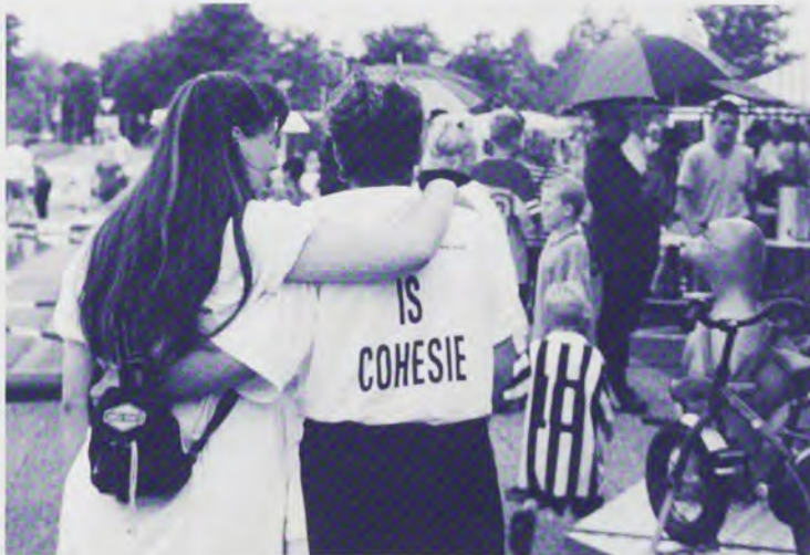
Tekst T-shirt: Buurt Sport Spelen is cohesie.