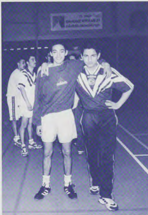
Zaalvoetbal: een succes.

Ondanks de wat magere resultaten zal Hoge Mors...gezonder en wel op zaterdag 18 september feestelijk worden afgesloten. Enkele sportverenigingen geven die dag een demonstratie, en ook de kinderen zullen