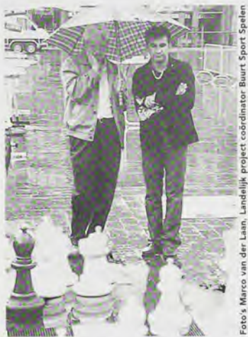
Foto's Marco van der Laan, Landelijk project coördinator Buurt Sport Spelen

Dan worden die contacten daarna waarschijnlijk ook blijvend.'