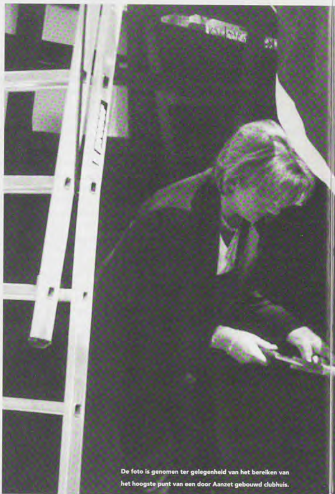
De foto is genomen ter gelegenheid van het bereiken van het hoogste punt van een door Aanzet gebouwd clubhuis.