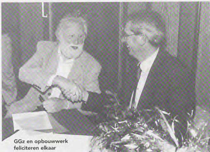
GGz en opbouwwerk feliciteren elkaar