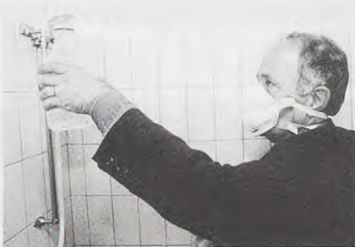
"De waterleidingen in dorpshuizen worden ook op legionella gecontroleerd"

"Dorpshuisbesturen worden met heel veel landelijk geldende regelgeving geconfronteerd. Voorbeelden zijn: de Drank en