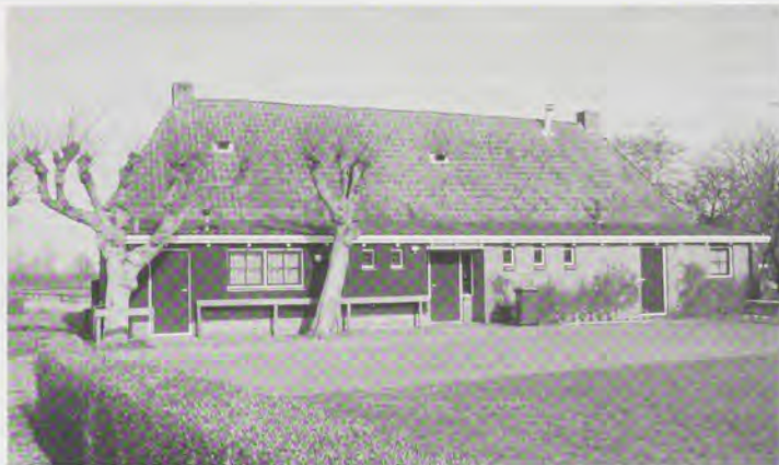
"Het dorps huis te Wier is gehuisvest in een karakteristiek gebouw"

De SDF heeft zich vanaf haar oprichting ontwikkeld tot een belangrijke koepelorganisatie voor de dorps huizen met een zeer herkenbaar gezicht voor de bij haar aangesloten leden. De SDF is daarnaast een belangrijke gesprekspartner geworden voor de Friese gemeenten en de provincie Fryslân als het gaat om zaken als accommodatiebeleid en subsidiëring van ver- en nieuwbouw van dorps huizen. De SDF draagt met haar werk bij aan het in stand houden en verbeteren van het fijnmazige sociale netwerk dat gevormd wordt door de 226 dorps huizen op het Friese platteland.