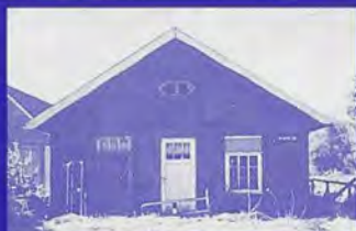
"Het eerste Friese dorps huis te Arum, deze voorziening is nu elders ondergebracht"

ten dorps huisbesturen te realiseren. In samenwerking met andere instellingen en fondsen worden projecten opgezet, zoals een energieproject voor dorps huizen met als doel het verbeteren en behouden van de functie die dorps huizen hebben op het Friese platteland.