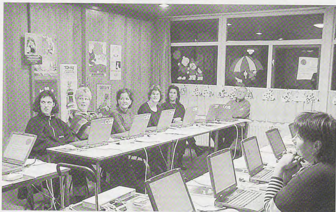
"De SDF is mede-initiatiefnemer van het internet-project Op Paad"

betrokken zijn. Het gaat dan om het project servicecentra onder de naam "Te Plak" Op dorpsniveau kun je een aantal diensten niet goed organiseren, daarvoor moet je wat meer op een regionale schaal werken, met in individuele dorpen een steunpunt of een loket. Ontwikkelingen rond wonen-zorg combinaties bieden kansen voor dorps huizen. Je hoeft immers niet alle activiteiten binnen het wooncomplex of verzorgingstehuis te organiseren. Het is voor ouderen ook goed om eens voor activiteiten er op uit te gaan naar een goed geoutilleerd dorps huis. Kijk dus goed naar de lokale situatie en ontwikkel projecten op maat, passend bij de vraag vanuit het dorp en rek, waar nodig, de beleidskaders maar wat op!" □