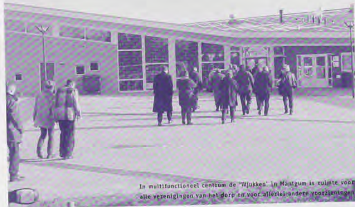
In multifunctioneel Centrum de "Wjukken" in Mantgum is ruimte voor alle verenigingen van het dorp en voor allerlei andere voorzieningen

de redenen daarvan is het gevoel van eenzaamheid dat veel mensen daar hebben. Dat komt omdat ouderen uit dezelfde (geboorte/woon)streek niet meer bij elkaar komen. Een oplossing voor dit probleem kan zijn mensen hier naar te vragen en de eventuele voorkeurswens van de zorgbehoevende gehoor te geven. Een andere suggestie is dat ouderen niet meer in een verzorgingshuis worden geplaatst, maar zo lang mogelijk thuis blijven wonen en hulp/dienstenverlening aan huis krijgen. Op lokaal niveau ontstaan nieuwe, creatieve initiatieven om welzijn en zorg anders te organiseren. Niet alleen om ouderen zo lang mogelijk thuis te laten wonen, maar ook om mensen in verschillende levensfasen werken, leren en zorgen te kunnen laten combineren. Het Nederlandse Instituut voor Zorg en Welzijn werkt hieraan onder de titel 'Breed wonen'. Zij onderzoeken wat er gebeurt als deze initiatieven aan elkaar worden gekoppeld, en wat de meerwaarde is voor mensen die arbeid en zorg willen combineren en voor ouderen die langer zelfstandig willen wonen. (Meer hierover is te lezen in het artikel 'Nieuwe woondiensten zeggen oude kokers de wacht aan' uit het Tijdschrift voor de Sociale Sector van maart 2002).