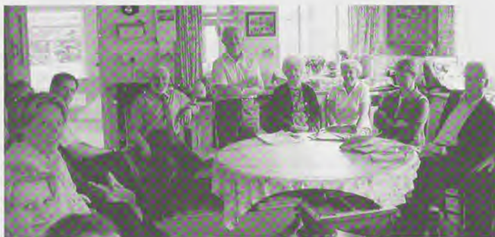
Op bezoek bij een boerderij die door varkenspest was getroffen. Persoonlijk leed, het werk van de vrijwillige telefonische hulpdienst, van de kerk, de dorpsgemeenschap en van de regering kwamen op indringende wijze aan de orde

Een groep van negentien veldwerkers, ambtenaren en onderzoekers uit de sociale sector maakte medio juni een studiereis naar de county Suffolk in Engeland. De doelstelling van de trip was tweeledig: het ontwikkelen van netwerken en kennis maken met de Engelse aanpak van sociaal beleid op het platteland