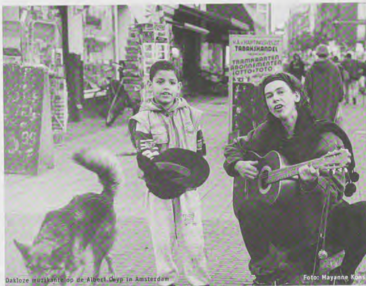
Dakloze muzikanten op de Albert Cuyp in Amsterdam

In september-oktober 2002 vindt de vijfde editie plaats van de Landelijke Daklozendag. De Landelijke Daklozendagen zijn erop gericht bij te dragen aan een evenwichtige beeldvorming over dak- en thuislozen. Anders dan voorgaen jaren, toen de Dag steeds op één plek werd georganiseerd, vinden vanaf 26 september in acht steden kleinschalige evenementen plaats. Iedere stad doet dat op zijn eigen manier. Een rijdend informatie- en expositiecentrum verbindt onder de noemer 'Dakozenbus-tour 2002' de steden met elkaar.