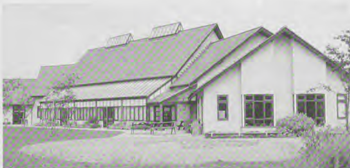
Het imposante Red Lodge Millennium Centre

ten en projecten geschetst, variërend van de ontwikkeling van community transport services tot child care projecten met ontbijt- en naschoolse opvang, van jongerenhuisvesting in het landelijk gebied tot de organisatie van boerenmarkten. Ook biedt de instelling concrete voorzieningen als vergaderruimte, pc-gebruik, et cetera.