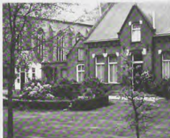
De pastorie is een voor iedereen geschikte locatie als inloopvoorziening voor mensen met een psychiatrische achtergrond

buurthuizenwerk en het werken met kwetsbare allochtonen. Terwijl er meer (voor de opleiding nog) onbekende, kwetsbare groepen in de samenleving zijn die meer aandacht nodig hebben, zoals mensen met een psychiatrische achtergrond. Argumenten dat de 'CMV-er' over te weinig achtergrondkennis beschikt van ziektebeelden en dergelijke, worden genoemd als reden niet met deze groepen in zee te gaan. De grote vraag is nu: is achtergrondkennis nodig om met psychiatrische patiënten te werken? Val je als je allerlei achtergrondkennis hebt vergaard, juist niet terug op de beperkingen van de groep in plaats van de mogelijkheden? Is de CMV-er juist niet de schakel om échte integratie te laten plaatsvinden?