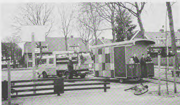
De Klapkeet is een nieuw instrument om bewoners persoonlijk in hun directe leefomgeving te benaderen

De wijkwandeling wordt gemaakt in samenwerking met de bewonersgroep Historische Werkgroep Oude Schil, een actieve groep