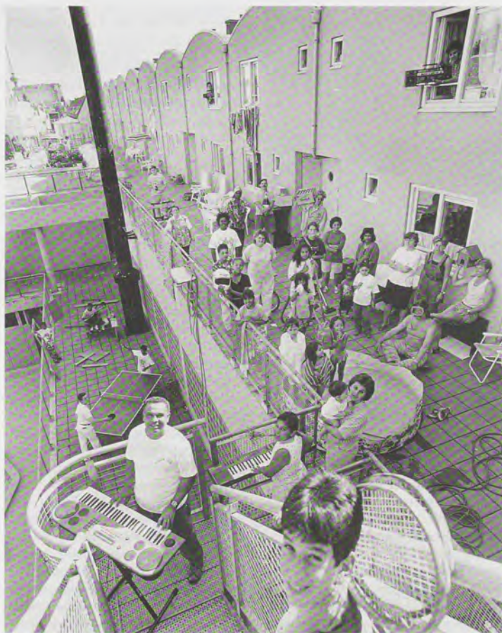
Het risico slachtoffer te worden van criminaliteit is kleiner in buurten waar mensen goed met elkaar omgaan

bewoners. Naast sociale kenmerken lijkt ook de Gelegenheidsstructuur van belang. Mensen worden eerder slachtoffer van een misdrijf in buurten waarin bewoners aangeven ontvreden te zijn over het aanbod van voorzieningen voor de jeugd, en over de kwaliteit van wegen en verlichting. Daarnaast vergroot het aanbod aan winkelvoorzieningen en bereikbaarheid van openbaar vervoer de kans dat bewoners slachtoffer worden van een misdrijf.