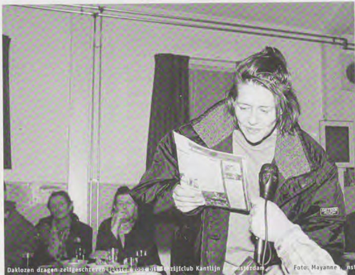
Daklozen dragen zelfgeschreven teksten voor bij de strijclub Kantlijn in Amsterdam.

kunnen worden voorgedragen. Onder de titel 'Alleen daklozen spreken de waarheid' wordt een videoproductie vertoond waarin dak- en thuislozen hun visie geven op hun leefwereld. Zij geven een antwoord op de vraag: 'Vertel iets uit je leven dat je nog nooit aan iemand hebt verteld'. Aan deze video, gemaakt in samenwerking met Daklozen-TV Amsterdam, werken daklozen uit alle deelnemende steden mee. Het maken van deze videoproductie is ook een belangrijk onderdeel van het voortraject.