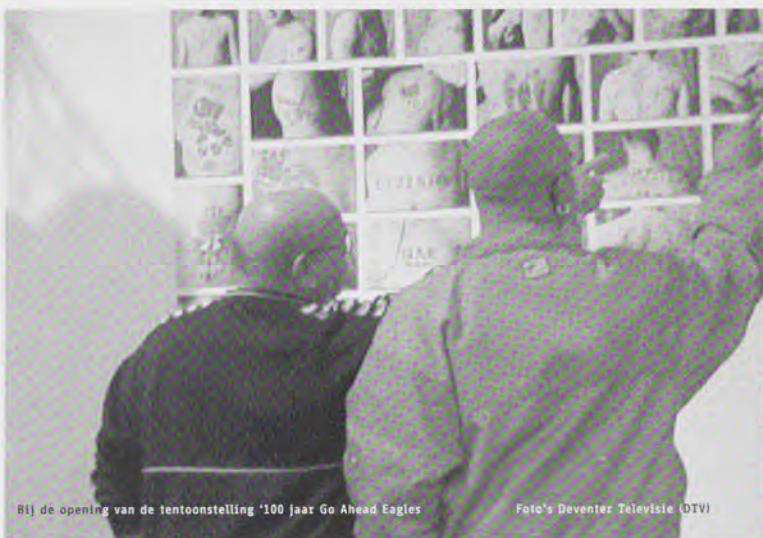
Bij de opening van de tentoonstelling '100 jaar Go Ahead Eagles'

Onder de naam 'Tattoos for Eagles' ging in Deventer een unieke samenwerking van start tussen de plaatselijke kunst- en supporterswereld. Op initiatief van de Deventer Cultuurmakelaar bedacht het supportersteam KIJgoed een kunstzinnige actie waarmee ze niet alleen de club wil steunen, maar ook de harde-kernsupporters op een positieve manier onder de aandacht brengen.