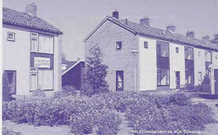
Het informatiepunt de wijk Tuindorp

'Eerst zien, dan geloven' vonden wijkbewoners bij de start van een wijkverbeteringsproject in Coevorden. De gelijknamige publicatie beschrijft niet alleen de ervaringen binnen een dergelijk project, maar geeft ook inzicht in de slaag- en faalfactoren.