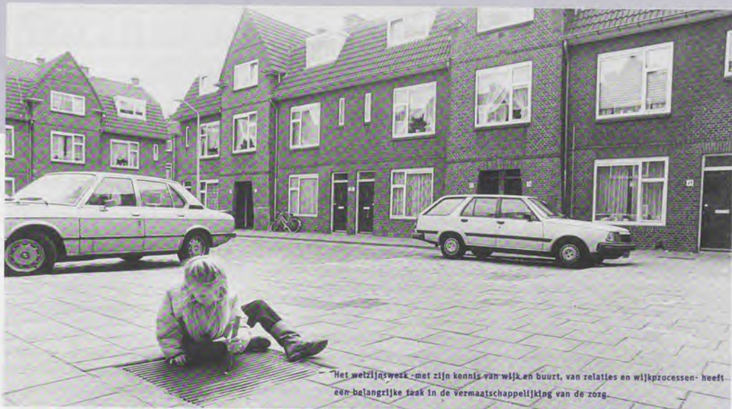
Het welzijnswerk met zijn kennis van wijk en buurt, van relaties en wijkprocessen heeft een belangrijke taak in de vermaatschappelijking van de zorg.

laten zien dat ze behoefte hebben aan sociale contacten. Netwerkontwikkeling en netwerkonderhoud zijn daarbij van belang. Breed de netwerken uit en schep samenwerkingsverbanden, aldus Meijer.