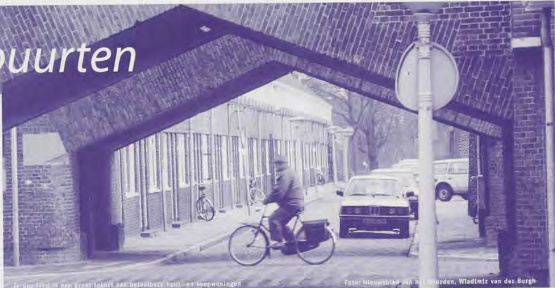
Levensland is een groot levert van betaalbare huur- en koopwoningen