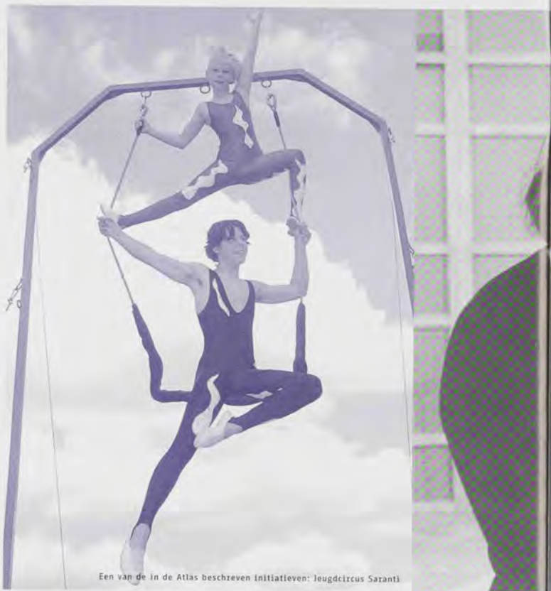
Een van de in de Atlas beschreven initiatieven: Jeugd circus Saranti

De Kansenaslas is onderdeel van een breder initiatief waarmee het Landelijk Centrum Opbouwwerk onder het motto 'weven aan samen leven' ruimte wil creëren voor kleinschalig particulier en nieuw maatschappelijk initiatief. In dit kader verscheen eerder het boek Dragers en Schragers , met portretten van informele leiders die de spil zijn van lokaal maatschappelijk initiatief.