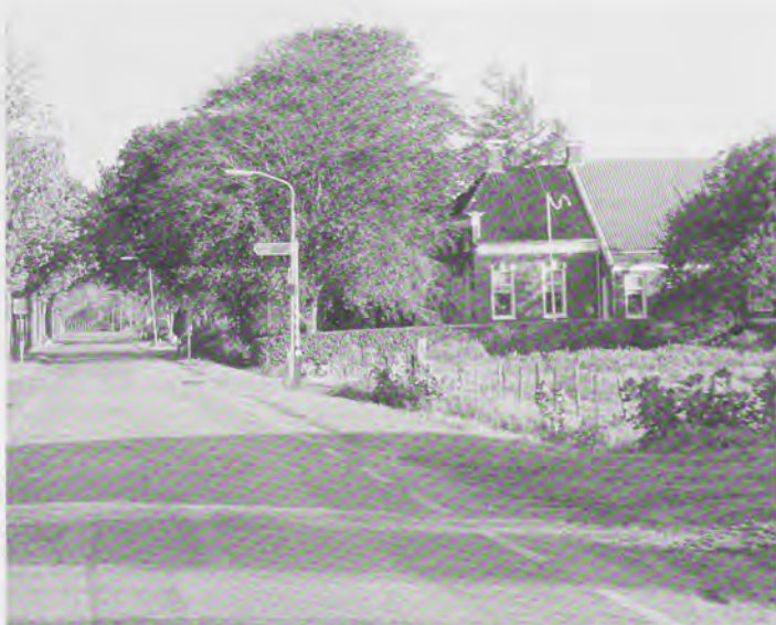
Veel keuzen zitten helemaal zonder voorzieningen, maar blijven door de auto aantrekkelijk

Als eerste het economische wiel: al decennia lang is de landbouw aan verandering onderhevig; iedere dag verdwijnen er boeren. Toerisme en recreatie vormen nieuwe peilers voor de plattelandseconomie, maar ook vind meer en meer kleinschalige bedrijvigheid aan huis plaats. Kijk maar eens in de huizenadvertenties hoeveel panden op het