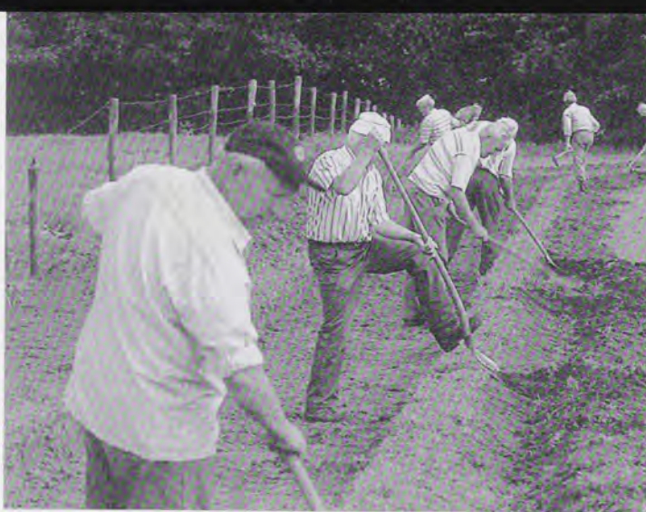
Stichting Kerkepaden (Gld). Bewoners van het dorp Zieuwent namen het initiatief om de oude (en veiligere) dorpspa- den in ere te herstellen

doen aan verschillende sectoren in het vrijwilligerswerk, uiteenlopende doelstellingen en spreiding in het land. Het belang van de Atlas is volgens de VNG-voorzitter dan ook dat daarin hoogwaardige projecten zijn beschreven, met verschillende werkwijzen op een breed terrein. "Iedere gemeente in het land kan daar aanvullende voorbeelden bij geven."