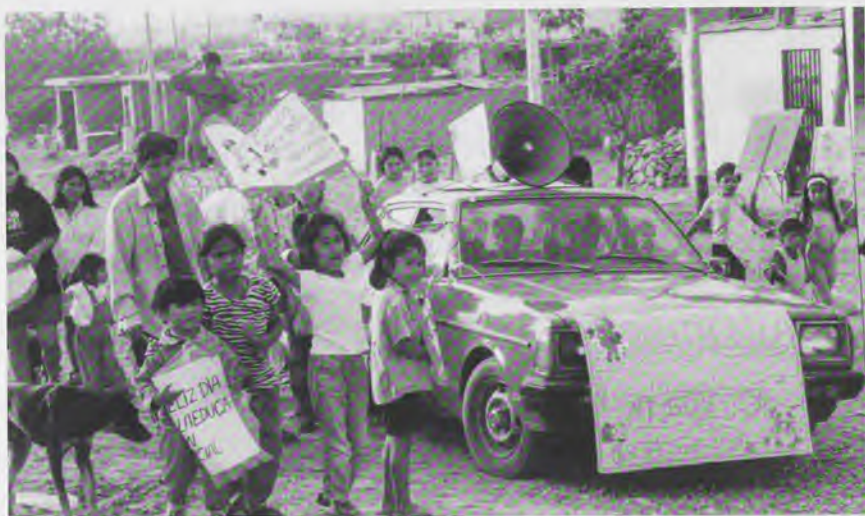
Aynimuno, een (Europees) Initiatief ter ondersteuning van jonge Peruaanse professionals die zich inzetten voor de bewoners van arme wijken in de Peruaanse hoofdstad Lima: openingsfeest van de peuterspeelzaal.

drijvende kracht in de samenleving. Terwijl ze dat wel zijn. "Uit onderzoek blijkt dat alleen al in Europa 6,5 miljoen mensen werken in een sociale onderneming. Sociale ondernemingen worden door burgers zelf wel omschreven als maatschappelijk belangrijk. Ze zijn -naast de publieke en de marktsector- te benoemen als een derde sector waaronder ook de non-profitinstellingen vallen. Tien procent van de totale werkgelegenheid in Europa is te vinden in deze derde sector. Daarnaast groeit de werkgelegenheid in deze sector nog steeds, terwijl in andere sectoren de werkgelegenheid afneemt."