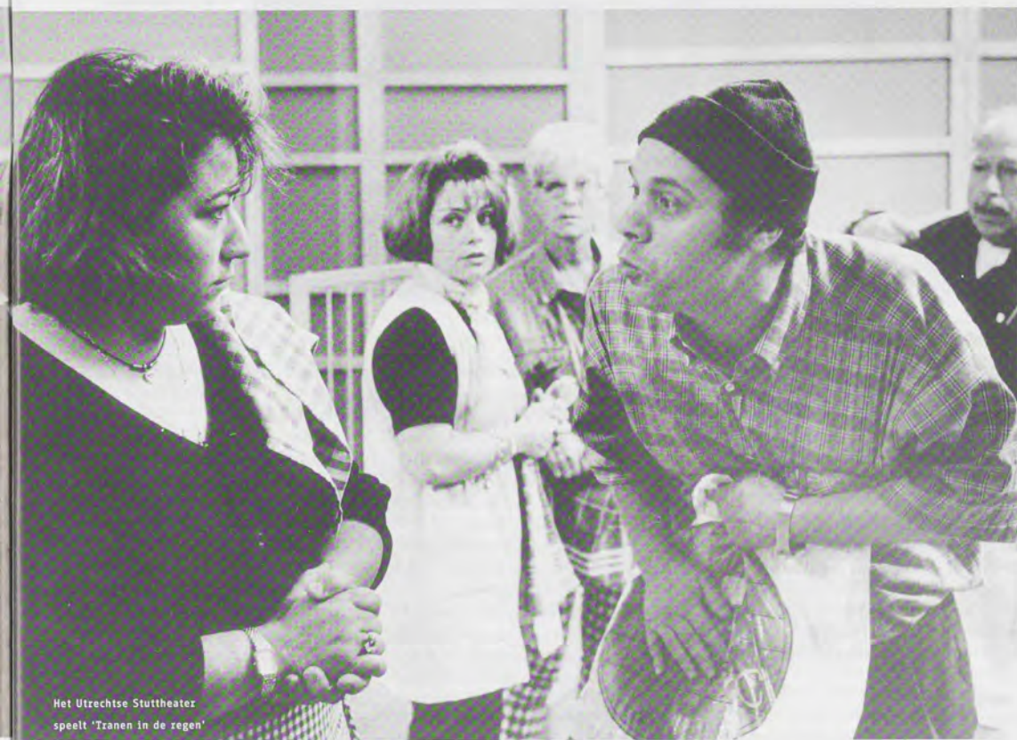
Het Utrechtse Stuttheater speelt 'Zanen in de regen'

een uitdaging die initiatieven te ondersteunen. Want opbouwwerk moet niet alleen inzetten op de zwakke krachten in de samenleving, dan mist ze de krachtige actoren." De kleine initiatieven uit de Kansentlas bieden volgens de LCO-directeur juist goede kansen dergelijke krachtige actoren te ontmoeten. "Aan de overheid en instanties is het een uitdaging die initiatieven te faciliteren. Niet zelf weer een product bedenken, maar de dingen bij de mensen laten. Anders houden we geen draad in handen en is er geen sociaal weefsel meer." Van de Leur stipte de koudwaterrees aan van ambtenaren die zijn gewend aan zaken doen met één enkel grootschalig instituut