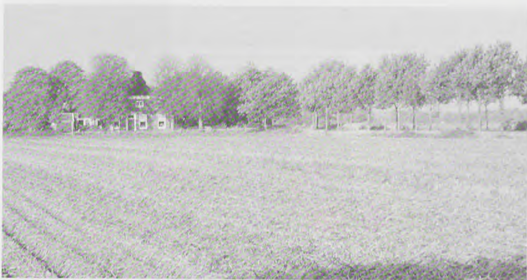
In tien jaar tijd is het platteland 'grondig verbouwd', niet alleen op ruimtelijk maar ook op economisch, sociaal-cultureel en politiek-bestuurlijk terrein

gewenste woonplekken. Het verdwijnen van een voorziening hoeft overigens niet altijd 'erg' te zijn, soms zijn er betere alternatieven. Zo vind ik het vervangen van een postkantoor door een servicepunt in de supermarkt, gezien de openingstijden, soms een goed alternatief. Van belang in dit domein is ook de situatie rond gemeenschapsaccommodaties die momenteel nogal wat belangstelling trekt. Veel dorpshuizen staan onder druk, niet alleen vanuit het exploitatieverhaal, maar ook vanuit de toenemende wet- en regelgeving op het gebied van milieu, arbo-problematiek, et cetera.