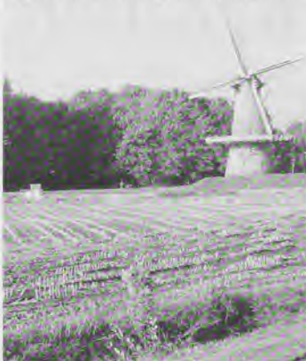
Mag er wel of niet worden gebouwd op het platteland?

te houden zijn. En dan moet je alles uit de kast trekken –en vooral het sociale kapitaal aanboren en activeren– om tot goed maatwerk te komen. Dat is ook mijn pleidooi naar (lokale) overheden en mijn aanbeveling naar lokale initiatiefgroepen, zoals dorpsbelangenorganisaties, dorpshuisbesturen, et cetera. Ik vind dat in ieder dorp minstens één voorziening in stand moet worden gehouden en ik vind ook dat de lokale overheid daar een soort basale plicht heeft. In ieder dorp hoort een plek voor ontmoeting, een dorpshuis, maar het mag van mij ook een café met subsidie zijn. Een plek, waar de bewoners elkaar kunnen ontmoeten, waar de basis kan worden gelegd voor contacten en plannen, een plek waar de sociale samenhang van de kleine gemeenschap vorm kan krijgen. Die plek vormt naar mijn overtuiging het begin van een goed voorzieningenniveau in het dorp. Die plek, dat dak, kan ook het fysieke begin zijn van prachtige op maat gemaakte voorzieningencombinaties. In het ene dorp zitten supermarkt, bankloket, kinderopvang, basisschool, jongerensoos, zorgloket en noem maar op onder één dak. In het andere dorp is dat zaaltje in het voormalig dorpscafé, dat alleen zaterdag van vier tot zeven open is, voor dat dorp een prima voorziening. Dat voorzieningen van belang zijn is een open deur! Draagvlak is een voorwaarde en dan doen bewoners en overheid of overheden samen.