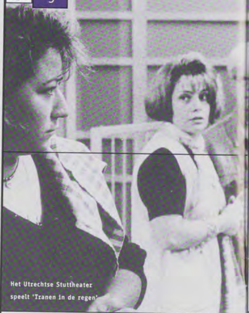
Het Utrechtse Stuttheater speelt 'Tranen in de regen'