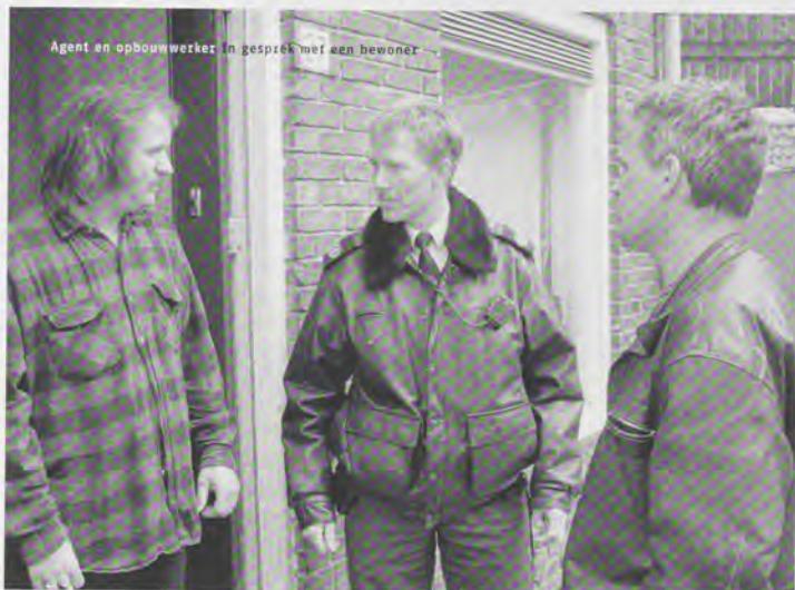
Agent en opbouwwerker in gesprek met een bewoner

van de in het project werkzame medewerkers, de coördinator van het basisteam en de voor het project verantwoordelijke ambtenaren. De belangrijkste taak van de stuurgroep was de randvoorwaarden creëren waaronder de samenwerking in het project van de grond kon komen.