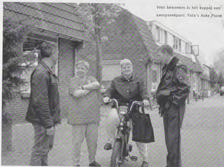
Voor bewoners is het koppel een aanspreekpunt.

In steeds meer grote steden gaan opbouwwerkers en agenten samen de straat op. Zij proberen bewoners weerbaar te maken en ze te stimuleren zelf problemen op te lossen. In 2000 ging in Deventer het pilot-project Zelfredzaamheid van start met als doel bewoners daarin extra te ondersteunen en een methodiek te ontwikkelen die toepasbaar is in andere wijken.