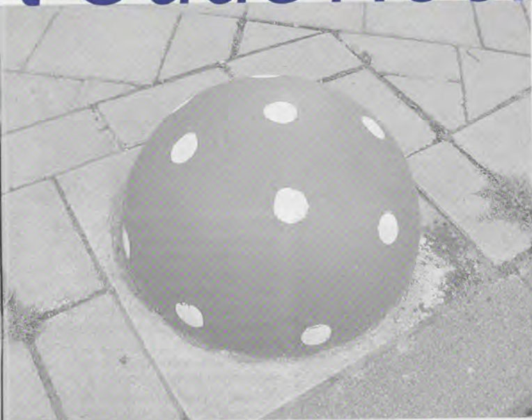
Paddelstoel : straatversiering in 't Oude Noorden

nepkwekerijen, illegale prostitutie en drugs-panden in de wijk.