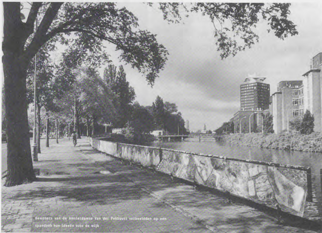
Bewoners van de Amsterdamse Van der Pekbuurt verbeeldden op een spandoek hun ideeën voor de wijk

opgedeeld in 25 stukken omdat het anders niet te verwerken is en ook om het na afloop van het project nog op andere plekken op te kunnen hangen. De producent heeft het voor ons op maat gemaakt, inclusief ringen om het aan op te hangen. Hiervoor gebruikten we stevige plastic aantrekstrips plus een staalkabel die door alle doeken liep. Met vrijwilligers uit de buurt hebben we het doek de ochtend voor de onthulling in razend tempo opgehangen.