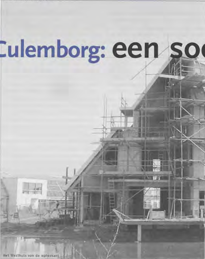
Het Werfhuis van de waleskant

In de zomer van dit jaar zal deze vernieuwende bouwplaats naar een andere plek in Culemborg verhuizen en zo mogelijk een volgende project beginnen, namelijk de Werfterp.