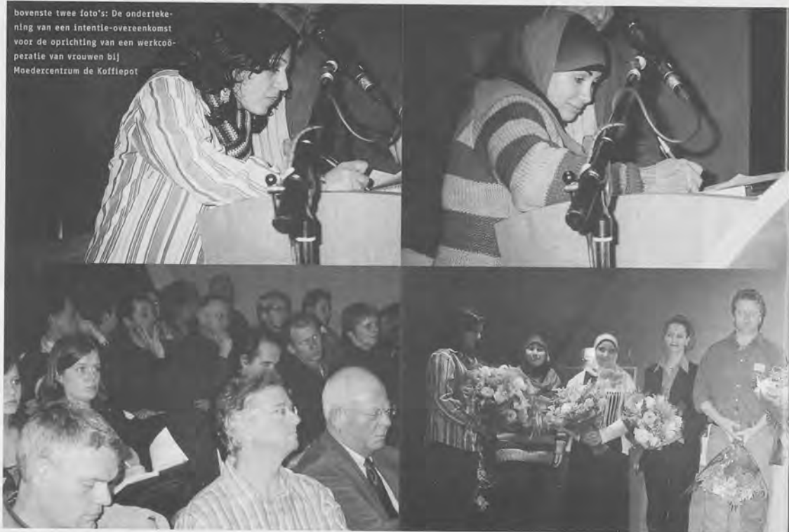
bovenste twee foto's: De ondertekening van een intentie-overeenkomst voor de oprichting van een werkcöperatie van vrouwen bij Moedercentrum de Koffiepot

Het enthousiaste gehoor reageerde merkbaar geïnspireerd op de inleiding van Wijffels. Allerlei aanwezigen spoedden zich om zijn mening te vragen over de initiatieven waar ze zelf mee bezig zijn. De spreker was meer dan bereidwillig om op al die vragen in te gaan en de bottom-line van zijn commentaar was steeds dat de door hem gesignaleerde bewustwording in de maatschappij kon worden gekenschetst als een organische ontwikkeling die eigenlijk niet tegen te houden valt. Het gaat hier om een verdere ontwikkeling van het maatschappelijk bewustzijn, die er ook voor zal zorgen dat bijvoorbeeld particulieren hun eigendommen zullen aanwenden in dienst van de samenleving.