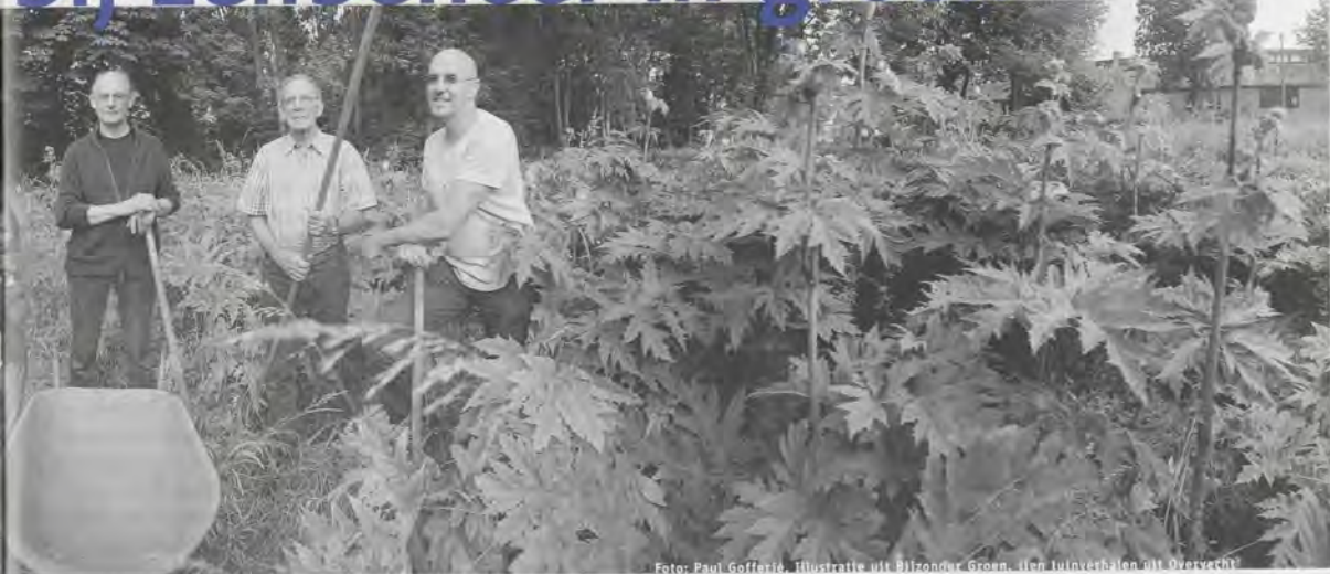
illustratie: J. J. Kroon, Groen, ten tuinverhalen uit Overvecht

met de pilots via een verbeterde kwaliteit van het openbaar groen ook de leefkwaliteit verbeteren.