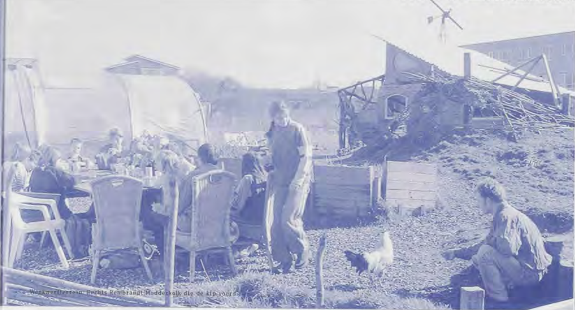
Werkwerfterrein. Rechts Rembrandt-Modelwolk die de kip voedt.

bivakkeren. De termijn liep dus snel af, terwijl de bouw van Het Werfhuis nog niet was voltooid. Bovendien waren er bij de ambtenaren van Culemborg een paar kleine ergernissen ontstaan die te maken hadden met niet gelegaliseerde bouwsels (zoals het Peru-huis) en slaappleaatsen waar geen vergunning voor was verleend.