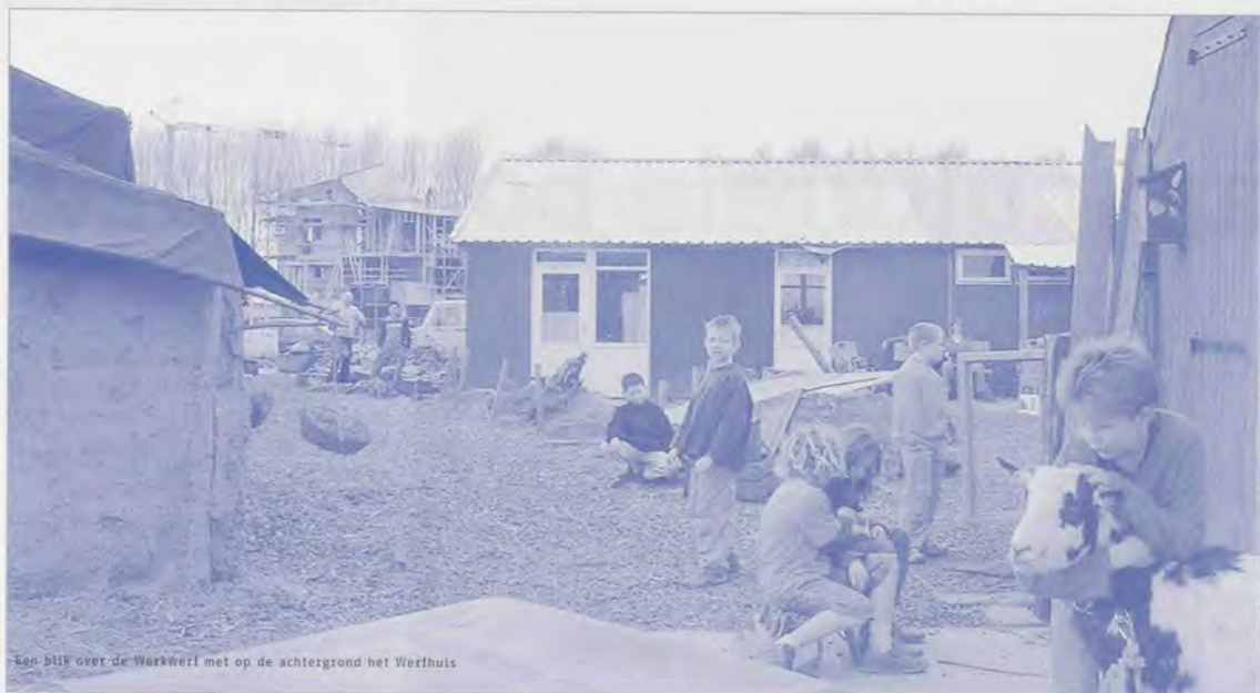
Een blik over de Werkwerf met op de achtergrond het Werfhuis

nu eenmaal twee verschillende dingen. Ik heb in mijn werk sterk met de spanning tussen die twee werelden te maken. Maar niet-temin is het vóór alles echt leuk. Er wordt hier over van alles en nog wat gepraat en in dit opzicht is De Werkwerf echt een broedplaats voor nieuwe ideeën."