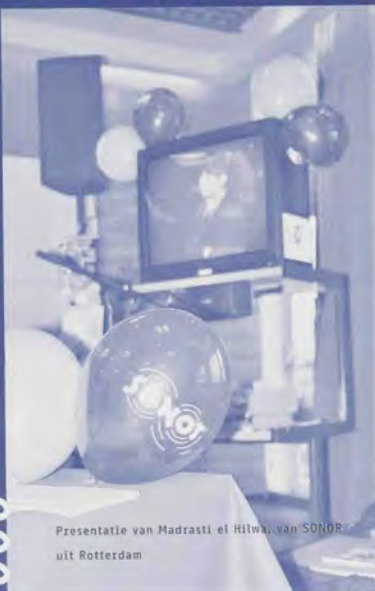
Presentatie van Madrast el Hilwa, van SONOR uit Rotterdam