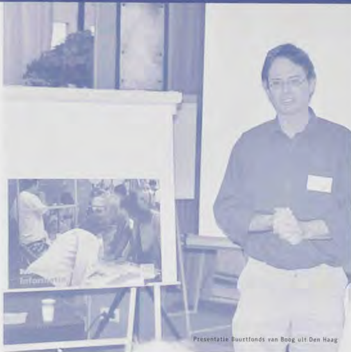
Presentatie Buurtfonds van Boog uit Den Haag

hun verwachtingen kunnen ventileren: niet de bewoners als gesprekspartner, maar de bewoners als spil in het overleg met begeleiding en ondersteuning van welzijn. Niet praten over, maar met de burger.