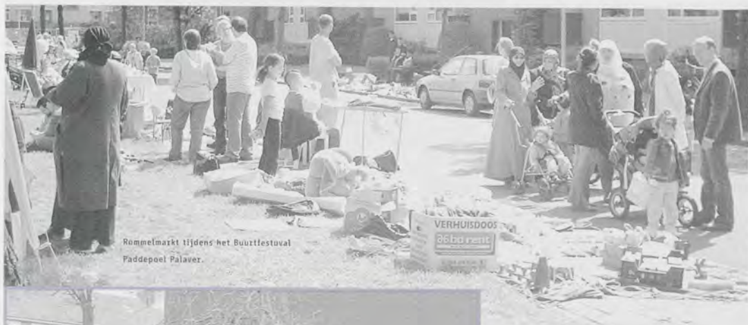
Rommelmarkt tijdens het Buurtfestival Paddepoel Palaver.