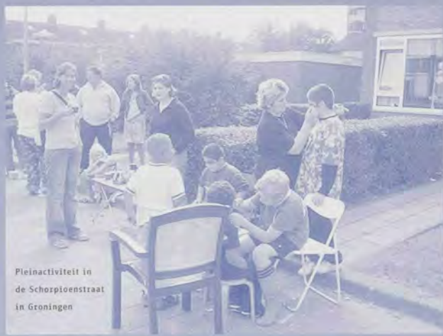
Pleinactiviteit in de Schorpioenstraat in Groningen

methode is om sleutelfiguren bij elkaar te halen. Dat doen we bijvoorbeeld met ouderen. Er zijn er altijd wel een aantal actief. Wij moeten niet bedenken wat goed of leuk is voor ouderen, dat moeten ze zelf bedenken. In Paddepoel wordt dat momenteel begeleid door het ouderenwerk omdat zij veel contacten hebben met ouderen."