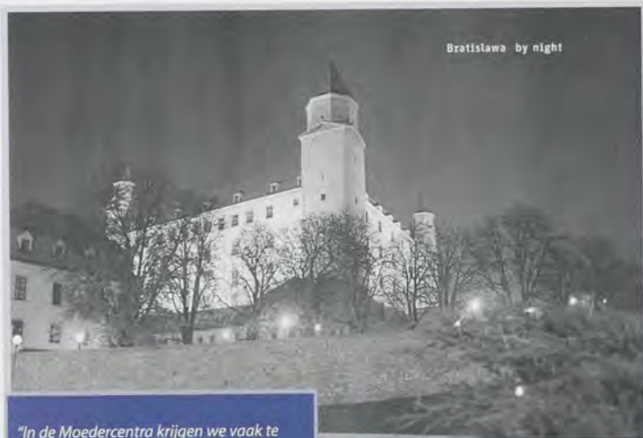
Bratislava by night

"In de Moedercentra krijgen we vaak te horen, waar zijn de vaders? Daar kan ik heel makkelijk een antwoord op geven. Ze zijn thuis, waar ze voor onze kinderen zorgen, zodat wij kunnen deelnemen aan deze conferentie."