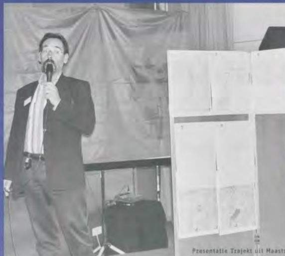
Presentatie Trajekt uit Maastricht