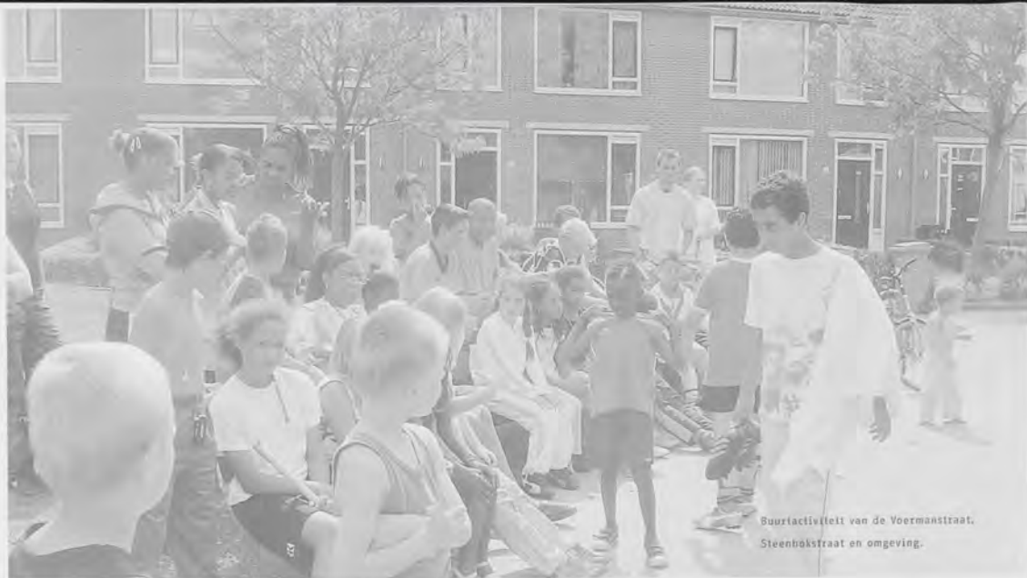
Buurtactiviteit van de Voermanstraat, Steenbokstraat en omgeving.

krijgen aangeboden, bijvoorbeeld op het gebied van meer bewegen en gezonder eten. Fictief: