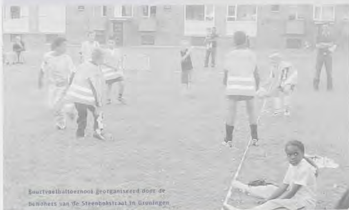
Buurtvoelbaltoernooi georganiseerd door de behoefters van De Steenbokstraat in Groningen

In de gemeentelijke nota 'Zorgen voor Morgen' krijgt Paddepoel een hoge prioriteit om er een Servicesteunpunt te realiseren. De inzet zal erop gericht zijn allerlei voorzieningen in de wijk samen te brengen in één servicesteunpunt. Hier kan men met vragen terecht en kan informatie verkregen worden over alle voorzieningen in de buurt. De medewerkers van het steunpunt zoeken vervolgens passende hulp. Vanuit dit servicepunt is een netwerk van hulpverleners actief. Zij stemmen hun diensten op elkaar af en gaan nauw samenwerken met vrijwilligers en mantelzorgers. Een hoofdrol bij de realisatie van het Stip krijgt de Ketenondersteuner (voor de