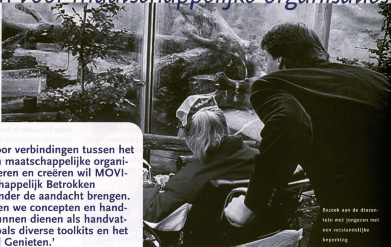
Bezoek aan de dierentuin met jongeren met een verstandelijke beperking

Door kansen voor verbindingen tussen het bedrijfsleven en maatschappelijke organisaties te signaleren en creëren wil MOVISIE het Maatschappelijk Betrokken Ondernemen onder de aandacht brengen. 'Ook ontwikkelen we concepten en handleidingen die kunnen dienen als handvatten bij MBO, zoals diverse toolkits en het concept Dubbel Genieten.'