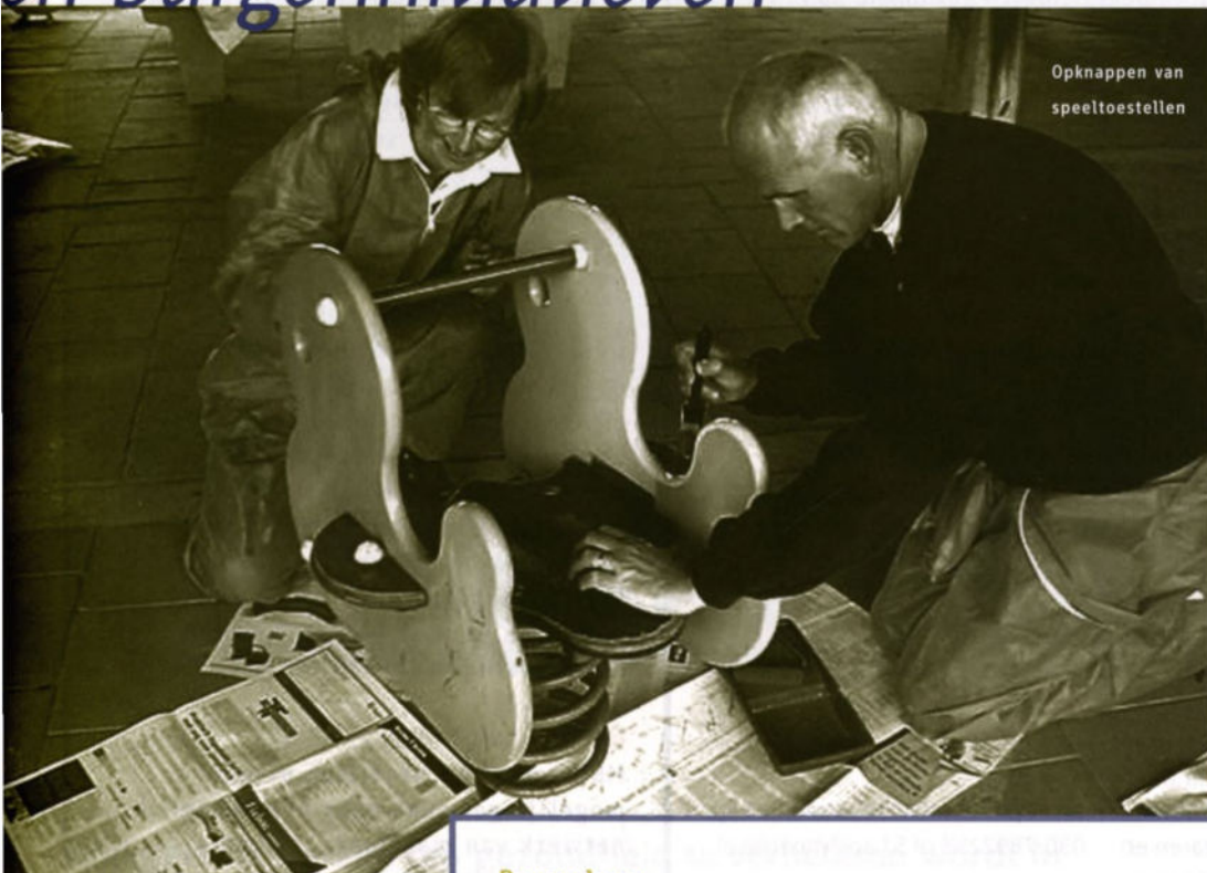
Opknappen van speeltoestellen

Dienstverlening, de welzijns-organisatie in Utrecht West."