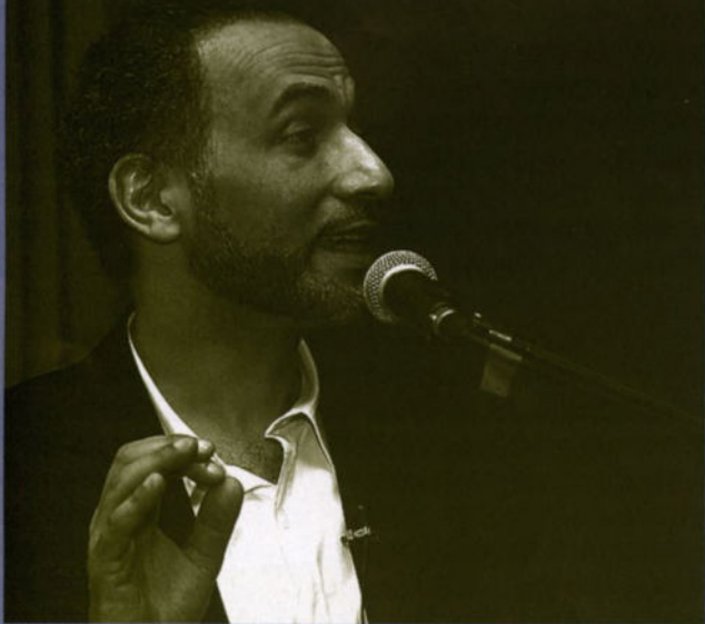
Tariq Ramadan: radicalisme begrijpen