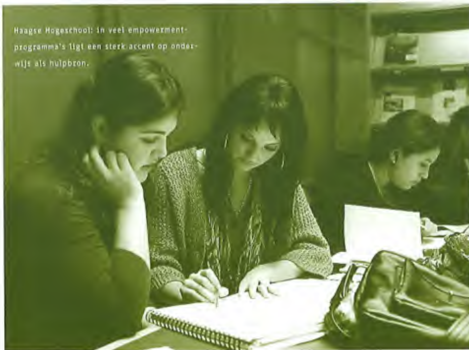
Haagse Hogeschool: in veel empowerment-programma's ligt een sterk accent op onderwijs als hulpbron.

nen de bakens worden verzet? Kunnen burgers in achterstandswijken niet alleen een grotere rol krijgen bij hun eigen persoonlijke herstelwerk of het herstelwerk van familieleden die in meer of mindere mate zijn ontspoord (kind, partner), maar ook bij het herstelwerk dat nodig is om hun wijken weer op de been te helpen. Hoe kan bovendien - veel meer dan nu het geval is - het potentieel van weerbare burgers worden benut?