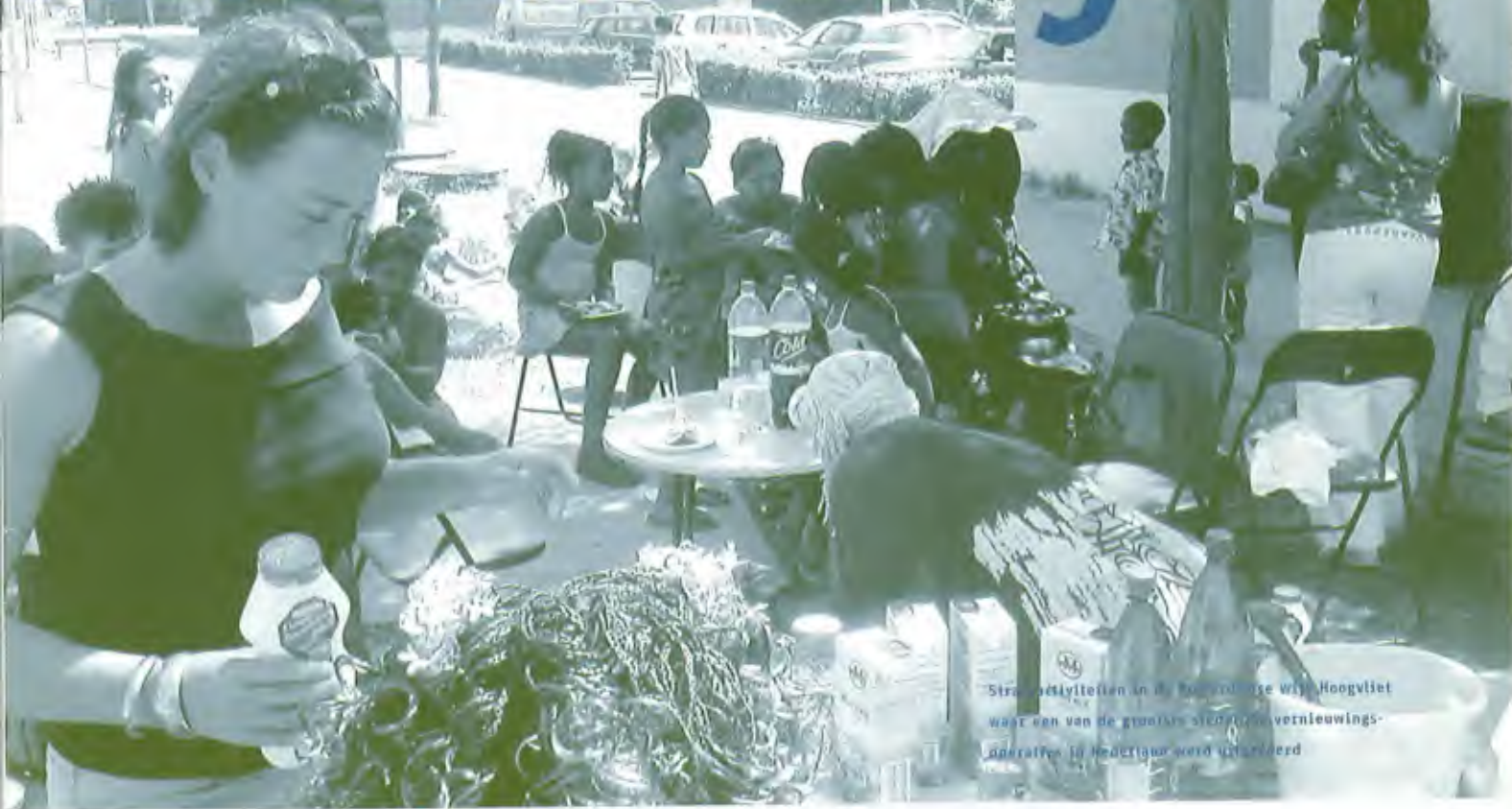
Stratwettijtelten in de Rotterdamse wijk Hoogvliet waar een van de grootste stedelijke vernieuwingsoperaties in Nederland wordt uitgevoerd

ven en hiervoor draagvlak verkrijgen bij de achterban.