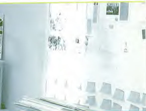
Deelnemer van de bank Overnuttige Kwaliteiten op zijn werkplek bij de Voedselbank

haar takenpakket gaat rekenen. Voor de uitvoering van die ambitie heeft de organisatie een groot aantal vaardigheden nodig en bovenal een uitstekend netwerk met alle bewoners en externe instanties. Wie de verwachtingen zo hoog opvoert, moet die ook af kunnen bakken en waar kunnen maken. Al was het maar om de betrouwbare organisatie te kunnen zijn met wie mensen aan de slag willen om hun eigen leven anders in te richten. Als corporaties dan de nieuwe speler en geldschieter in welzijnsland willen zijn, moet de verschuiving van verantwoordelijkheden bovendien niet leiden tot onduidelijkheid of verschraling. Het algemeen maatschappelijk werk heeft bijvoorbeeld de laatste decennia steeds minder budgetten gekregen van Rijk en gemeenten. Het is belangrijk dat de overheid zich niet verder terugtrekt op het moment dat corporaties tijdelijke projecten gaan ondersteunen. Tenslotte nog een inhoudelijke waarschuwing door Gruis en Kerkhoven (2008) aan professionals van de corporaties: hoewel een steuntje voor veel huurders vast welkom is, is het goed om te bedenken wie dat steuntje het best kan geven. Bij elk opstijging gericht project moet de corporatie zich afvragen wie de meest geëigende partij is om het project uit te voeren. Moet de welzijnstaak worden overgenomen, slechts bekostigd of misschien geheel aan het woonbedrijf voorbij gaan? Als een ander het beter doet, is het beste perspectief: schoenmaker, blijf bij je leest!