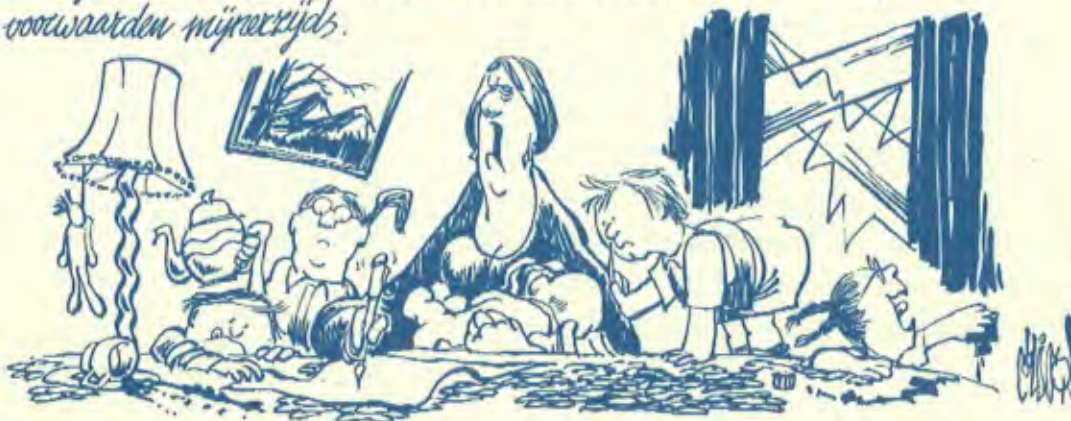
Cartoon, door Jos Collignon voor de Pijler gemaakt voor Vrouwen in de Bijstand (VIB)

Mijn liever, KEES! KNIKKERS UIT JE NEUS! Ingevolge God mag welen EVEN JE MOND DICHT JONGENS! wat voor nieuwe wettelijke GA MET DAT BROODMES UIT HET STOPKONTAKT verplichting solliciteer ik als bij- standsmoeder HOU JE SCHREEUW NOU'S! ZIE JE NIET DAT IK ZIT TE VOEDEN! naar de functie van directiesecretaresse. Er zijn echter JA, JULLIE MOGEN ALLEMAAL MET MAMMA MEE enkele bijzondere voorwaarden mijnerzijds.