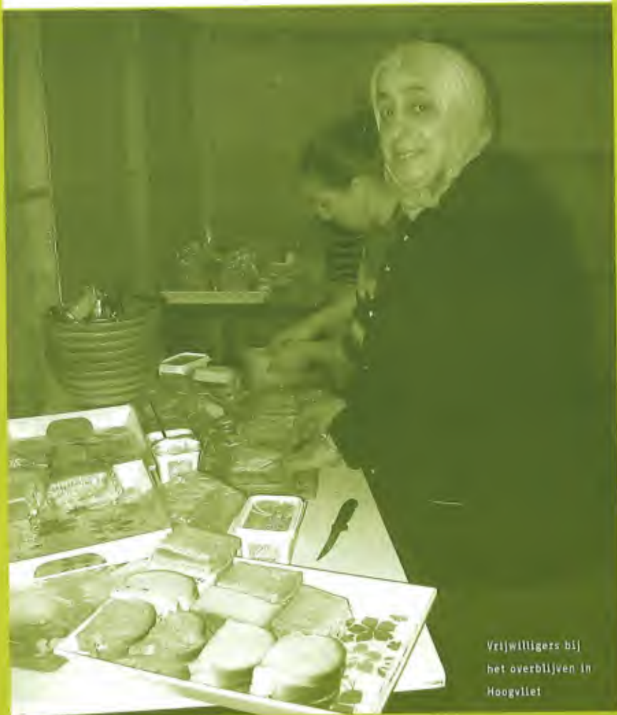
Vrijwilligers bij het overblijven in Hoogvliet