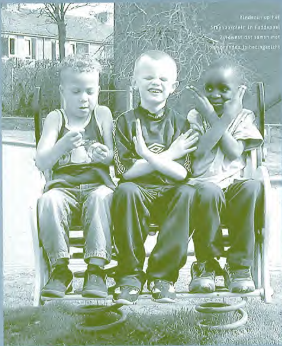
Kinderen op het Steenbokplein in Paddepoel Zuidwest dat samen met bewoners is belevingsgericht

door met het project om bijstandsgerechtigden actief te krijgen in hun eigen buurt tegen een vrijwilligersvergoeding bovenop de uitkering.