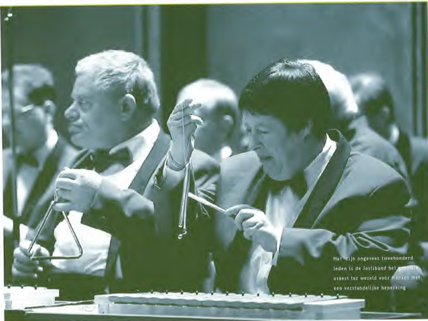
Met zijn ongeveer tweehonderd leden is de Jostiband het grootste orkest ter wereld voor mensen met een verstandelijke beperking

aal contact missen. Een ander probleem dat de geïnterviewden vaak noemden is hun angst niet voor vol te worden aangezien door 'gewone' mensen. Dat doet hen nogal eens besluiten om maar helemaal niet meer te proberen in contact te komen met anderen dan lotgenoten. Bij de meeste geïnterviewden komen uitsluitend familieleden en begeleiders van de zorginstellingen over de vloer. Deze laatsten noemen zij vaak de belangrijkste persoon in hun leven. Zij zien uit naar het vaste moment van de dag of de week waarop de begeleider bij hen komt; dat is degene met wie zij het reilen en zeilen in hun dagelijks leven bespreken en bij wie zij hun hart uitstorten.