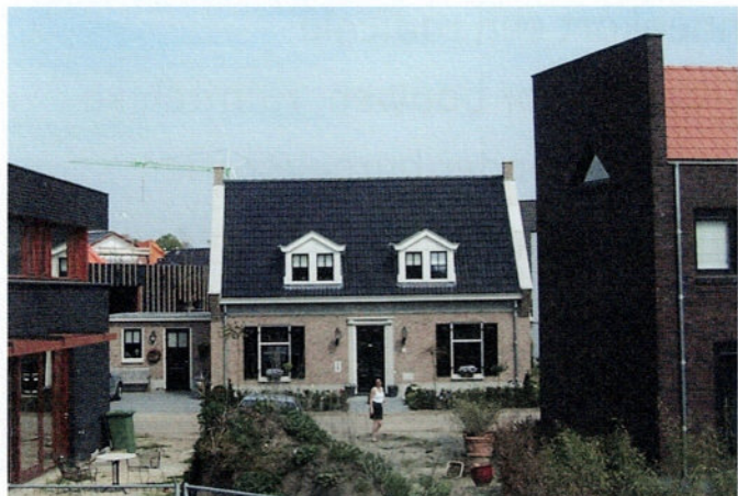
Traditioneel naast hypermodern in welstandsvrij Roombeek (Enschede)