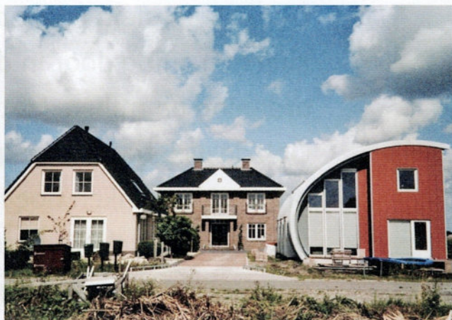
Particulier opdrachtgeverschap in Nesselande (Rotterdam)

zonder lage kosten: van elke duizend euro die in ons land aan nieuwe gebouwen wordt uitgegeven, gaat momenteel slechts 25 cent naar de garantie van onze omgevingskwaliteit.