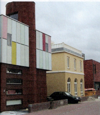
Particulier opdrachtgeverschap op Steigereiland (Amsterdam)